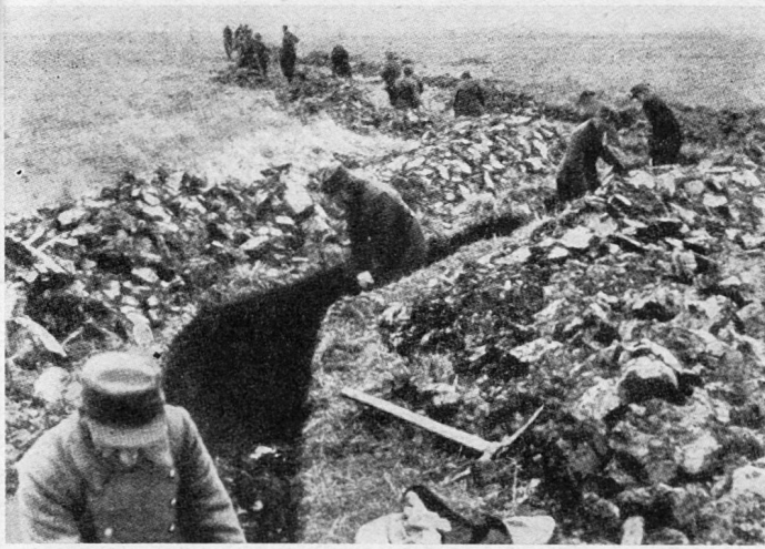
Volkssturm beim Ausbau einer rückwärtigen Stellung im Winter 1944/45

was böses Blut machte. Die Ausbildung wurde meist gar nicht durchgeführt. Dies hatte zur Folge, daß die in höchster Not einberufenen Volkssturm-Einheiten meist ohne jegliche Ausbildung zum Kriegseinsatz kamen.