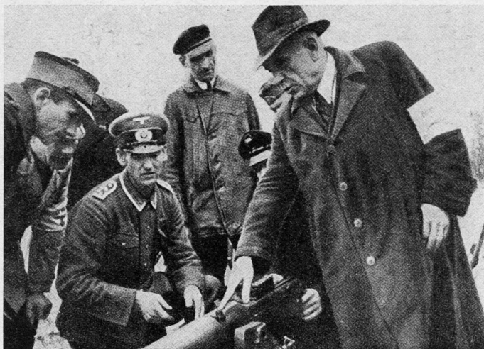
Ausbildung des Volkssturmes am Mg. 08

Als Führer waren «zuverlässige und standhafte Nationalsozia-