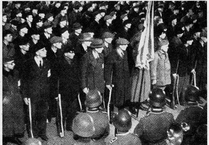
Appell des ostpreußischen Volkssturmes in Königsberg am 18. Oktober 1944

Damit nahm der Gedanke Gestalt an, in den bedrohten Ostprovinzen einen Landsturm zu errichten. In der Frage, wer diesen Landsturm aufzustellen habe, setzte sich der Standpunkt der Partei durch, wonach die Bildung des deutschen Volkssturmes nur eine Aufgabe der politischen Organisation der Partei und damit eine Aufgabe der Gesamtbewegung sein könne, weil nur diese über die erforderlichen Führungskräfte und Karteien verfüge, so daß zur Erfassung keine neuen Karteien anzulegen seien. Am 25. September 1944 unterzeichnete Hitler den «Erlaß des Führers über die Bildung des Deutschen Volkssturms». Bereits am 18. Oktober traten viele Tausende von Volkssturmmännern zum ersten Appell und zur Rede Himmlers an; am 20. Oktober kämpften sieben ostpreußische Volkssturm-Bataillone an der Front.