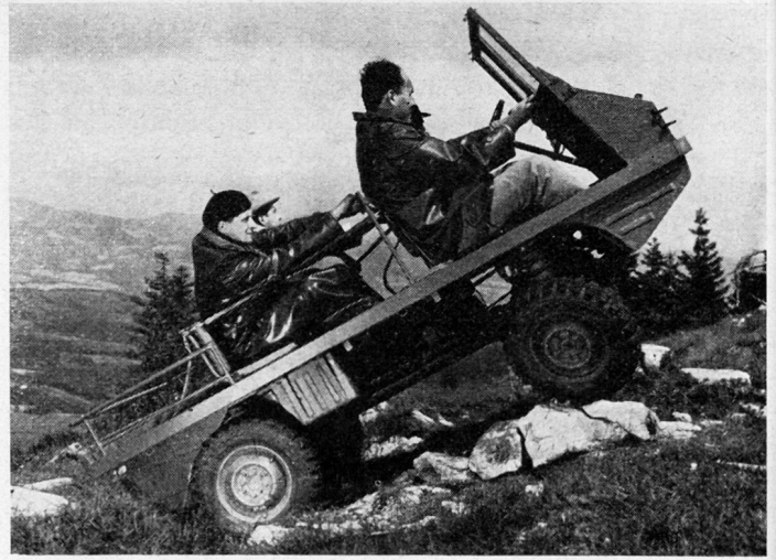
Geländelastwagen Haflinger bei Steigversuchen im Gelände. Für den Einsatz in der Armee dürfen keine Personen auf der Ladebrücke transportiert werden

Der Fahrer bedient das vollsynchronisierte Fünfganggetriebe mit einem normalen Schalthebel. Die Einscheibenkupplung wird durch Pedal betätigt, ebenso die hydraulische Vierradtrommelbremse. Der Vorderradantrieb kann während der Fahrt ein- und ausgeschaltet werden. Sowohl die Vorderräder wie auch die Hinterräder sind je mit einem Sperrdifferential versehen, die während der Fahrt einzeln eingeschaltet werden können. Der erste Getriebegang ist als Kriechgang ausgebildet und gestattet eine Mindestgeschwindigkeit von 2,5 km/h, so daß das Fahrzeug auch an Steigungen im Fußmarsch begleitet werden kann. Andererseits erlaubt die Höchstgeschwindigkeit von 60 km/h im fünften Gang das Halten des Tempos von flüssig fahrenden Kolonnen von leichten Geländelastwagen. Die weiche Federung besteht aus Schraubenfedern und zusätzlichen, progressiv wirkenden Gummihohlfedern.