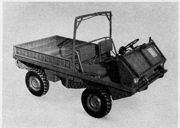
Das Fahrzeug mit demontiertem Verdeck und nach vorn abgeklappter Windschutzscheibe