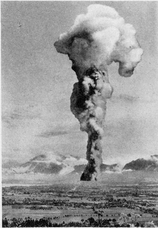
Fig. 2. Explosion mit hohem Sprengpunkt einer 40-KT-Bombe in schweizerisches Gelände eingetragen. Bei Beobachtung eines solchen Phänomens wären als rasche Meldungen äußerst wünschbar: Azimut des Pilzfußpunkts, Höhe des Pilzstammes, Durchmesser des Pilzhutes in ‰ und Gestalt des Pilzes.

die Meldungen beschaffen sein müssen, um ihren Zweck erfüllen zu können.