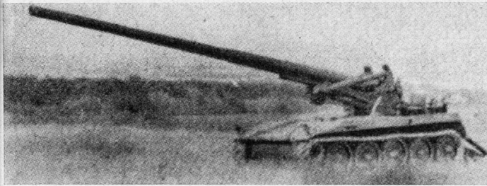
Auslieferung des T114

Die Auslieferung des T114, eines leichten Schützen- und Aufklärungspanzers mit Aluminiumpanzerung, hat begonnen. Dieses Modell ist für Aufklärungseinsätze sowie als fahrbarer Kommandoposten vorgesehen. Er ersetzt teilweise den Jeep in den Aufklärungsverbänden. Der T114 ist schwimmfähig, kann als Last abgeworfen werden und soll sich für jedes Gelände und alle klimatischen Bedingungen eignen. Die Besatzung besteht aus drei Mann; es ist Platz für einen vierten Mann vorhanden. Im Wagen kann jede moderne Funkanlage mitgeführt werden. Auf der Kuppel des Kommandanten befindet sich ein 12,7-mm-Maschinengewehr, über der Luke des Beobachters ist ein 7,62-mm-Maschinengewehr angebracht.