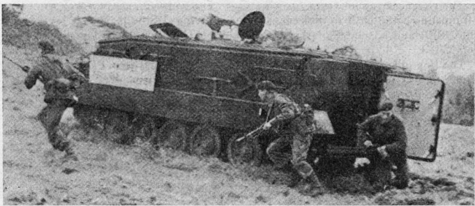
Der Schützenpanzer «Trojan» im Einsatz

Britische Infanterieeinheiten werden nun mit dem neuen Schützenpanzer FV 432 «Trojan» ausgerüstet. Dieses Vollkettenfahrzeug ist schwimmfähig und besitzt die Geländegängigkeit eines Panzers. Die Straßengeschwindigkeit beträgt rund 45 km/h. Der «Trojan» ist vollschließbar und schützt seine Besatzung gegen radioaktiven Fall-out, Splitter und kleinkalibriges Feuer. Für extreme Witterungsverhältnisse sind Heizung und Klimaanlage vorgesehen. Der neue Schützenpanzer der britischen Armee stellt den Grundtyp einer neuen Familie von Kettenfahrzeugen dar für den Einsatz als Kampffahrzeug, Sanitäts-, Nachschub- oder Kommandowagen. Der «Trojan» ist lufttransportierbar; im Wasser wird er durch die Ketten angetrieben. Zu.