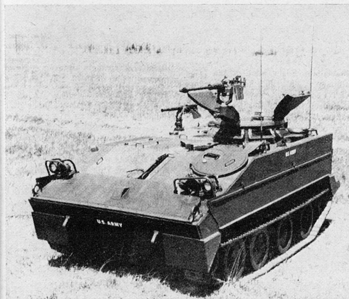
Der Aluminium-Schützen-und-Aufklärungspanzer T114

Die Auslieferung des T114, eines leichten Schützen- und Aufklärungspanzers mit Aluminiumpanzerung, hat begonnen. Dieses Modell ist für Aufklärungseinsätze sowie als fahrbarer Kommandoposten vorgesehen. Er ersetzt teilweise den Jeep in den Aufklärungsverbänden. Der T114 ist schwimmfähig, kann als Last abgeworfen werden und soll sich für jedes Gelände und alle klimatischen Bedingungen eignen. Die Besatzung besteht aus drei Mann; es ist Platz für einen vierten Mann vorhanden. Im Wagen kann jede moderne Funkanlage mitgeführt werden. Auf der Kuppel des Kommandanten befindet sich ein 12,7-mm-Maschinengewehr, über der Luke des Beobachters ist ein 7,62-mm-Maschinengewehr angebracht.