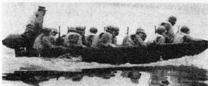
Die Gruppe im Angriff

Im Reglement 51.19 «Grundschulung für alle Truppengattungen» steht im Kapitel «Einsatzarten im Feuerkampf der Gruppe» auf Seite 236: «Im unterteilten Einsatz wird der Feuerkampf mit mehreren Trupps geführt. Jeder Trupp bekämpft selbständig seine Ziele. Die Feuerleitung kann für den Trupp beim Gruppenführer, bei seinem Stellvertreter oder bei einem Kämpfer liegen. Unterteilten Einsatz beispielsweise anwenden, wenn die Gruppe mehrere Aufgaben gleichzeitig zu erfüllen hat. Außerdem, wenn ausnahmsweise Feuer und Bewegung innerhalb der Gruppe nötig ist.»