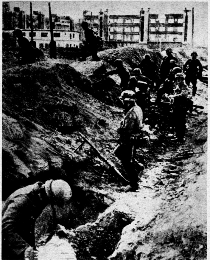
Deutsche Infanterie in den Schützengräben in Stalingrad Aus «Der Zweite Weltkrieg in Bildern und Dokumenten», 2. Band, Besprechung in dieser Nummer Seite 95

Aus «Der Zweite Weltkrieg in Bildern und Dokumenten», 2. Band, Besprechung in dieser Nummer Seite 95