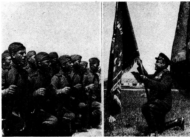
Bild 6. Verteidigung in der Sowjetarmee: «Ich schwöre und gelobe...»

wjetunion, lege, in die Reihen der Streitkräfte eintretend, meinen Eid ab und schwöre feierlich, ein ehrlicher, tapferer, disziplinierter, wachsamer Krieger zu sein, Kriegs- und Staatsgeheimnisse streng zu wahren, der Dienstordnung widerspruchslos Folge zu leisten und die Befehle meiner Vorgesetzten auszuführen. Ich schwöre, daß ich gewissenhaft das Kriegshandwerk erlernen, Armee- und Volkseigentum hüten und meinem Volke, meiner sowjetischen Heimat und der Sowjetregierung bis zum letzten Atemzuge treu ergeben sein werde. Ich bin stets bereit, auf Befehl der Sowjetregierung zur Verteidigung meines Vaterlandes – der Sowjetunion – anzutreten; als Krieger der Sowjetstreitmacht schwöre ich, mein Vaterland mannhaft, geschickt, würdig, ehrenhaft und ohne mein Blut, selbst mein Leben zu schonen, zu verteidigen, bis der volle Sieg über den Feind erungen ist. Sollte ich aber diesen meinen feierlichen Eid brechen, so treffen mich die harte Strafe der Sowjetgesetze, der Haß der Öffentlichkeit und die Verachtung der Werktätigen 33 »