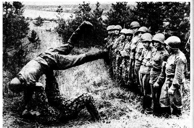
Bild 5. Die Ausbildung ist hart... Sambo (samozaschita bez oruz hiya – Selbstverteidigung ohne Waffen) täglich nach Rangers-Methode.

Jeder Angehörige der Sowjetstreitkräfte muß nach Abschluß seiner Grundausbildung – gewöhnlich Ende Januar – in feierlicher Form den folgenden Eid leisten: «Ich, ein Bürger der So-