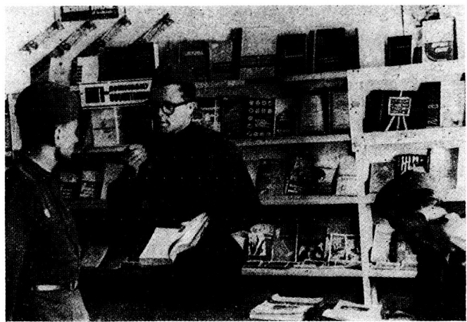
Bild 7. 100 Millionen Bücher in den Armeebibliotheken: «Die Leninsche Erkenntnis ist die mächtigste Waffe.»

Bis vor einigen Jahren gab es dreierlei Offiziersmessen: eine