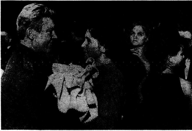
Bild 8. In einem sowjetischen Offiziershaus: «90 % Partei- oder Komsomolmitglieder.»

lionen Komsomolzen. 1958 waren über 70 % der Parteimitglieder in Regiments- und in höheren Kommandostäben konzentriert, während die restlichen auf kaum 40 % der unteren Verbände entfielen. Heute aber bestehen in 93 % dieser Einheiten Parteiorganisationen 38 .