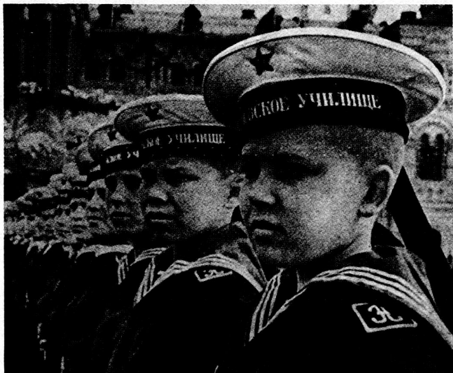
Bild 3. Marinekadetten an der Parade. Paramilitärische Erziehung von Jugend auf.

Die Vorbereitung der Jugendlichen, die zu den Streitkräften einberufen werden, wurde in den letzten Jahren erheblich intensiviert. Im Jahre 1963 zum Beispiel gehörten 78,2% der Wehrpflichtigen dem Komsomol an, und 93,6% trugen das GTO-Abzeichen 17 .