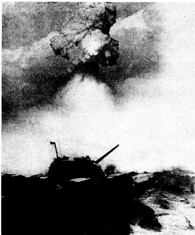
Bild 1 «Der erste Kernwaffenschlag entscheidet den Ausgang des Krieges». Sowjetmanöver unter Kernwaffenverhältnissen