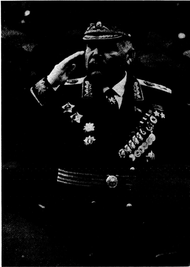
Bild 2. Marschall Rodion Jakowlewitsch Malinowski, Verteidigungsminister der UdSSR: «Die Sowjetunion ist überlegen.»

UdSSR ist Ehrenpflicht der Bürger der UdSSR 5 .» In der Sowjetunion müssen alle männlichen Bürger, die das 19. Lebensjahr vollendet haben – unter den Absolventen der Mittelschulen diejenigen, die das 18. Lebensjahr vollendet haben –, im Rahmen der Streitkräfte Militärdienst leisten 6 . Das Präsidium des Ober-