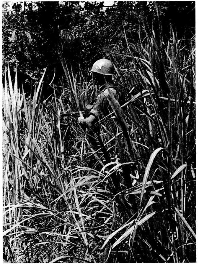
Bild 2. Schwedischer UNO-Soldat im Kongo.

zwischen UNO-Streitkräften und der katangischen Gendarmerie. Auf UNO-Seite operierte man im Verband einer Brigade, die zeitweise von einem Schweden geführt wurde. Als im Sommer