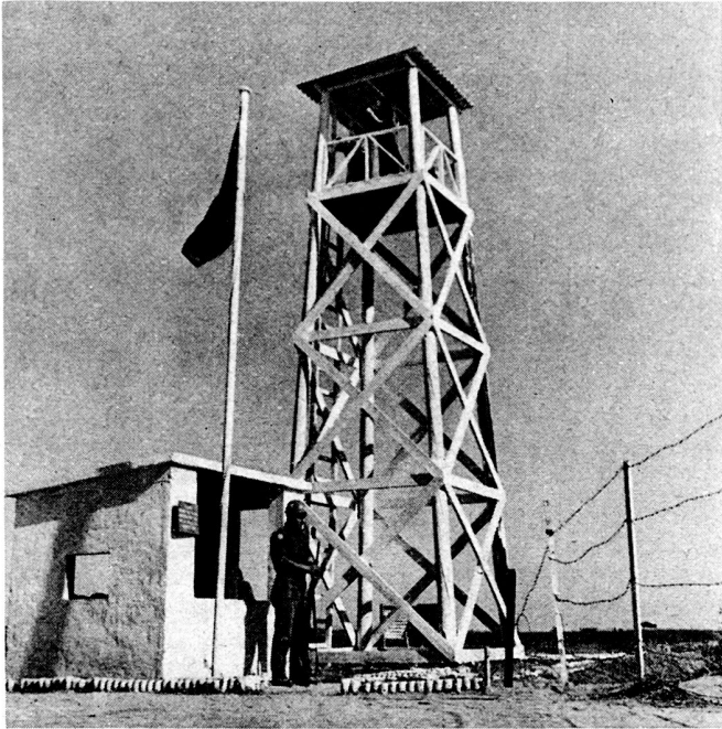
Bild 1. Schwedischer UNO-Posten an der Demarkationslinie zwischen Ägypten und Israel im Gazastreifen.

Allgemein könnte man sagen, daß die UNO-Verbände in Situationen benötigt werden, die nicht mehr nur von Offiziersgruppen gemeistert werden können. So galt es zum Beispiel in der ersten Aktion dieser Art, einleitend sicherzustellen, daß die Kampfhandlungen im Raume Suez-Sinai beendet wurden und daß die beiden Parteien in ihre Ausgangslagen zurückgingen. An dieser Aktion nahm Schweden von Anfang an mit einem reduzierten Bataillon teil. Die United Nations Emergency Force besteht noch immer, jetzt aber mit der Aufgabe, im Gazastreifen