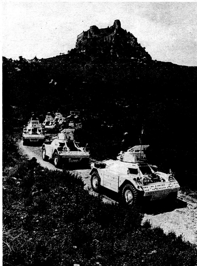
Bild 7. Panzerspähwagenzug des schwedischen Zypernbataillons, ausgerüstet mit britischen «Ferrets», während einer Patrouille im nördlichen Teil der Insel. Im Hintergrund die Kreuzritterburg Kantara. Um Mißverständnisse zu vermeiden, waren die meisten UNO-Fahrzeuge weiß gestrichen und mit den Zeichen und der Flagge der UNO versehen.

Seit einiger Zeit werden in Schweden sogenannte «Bereitschaftsstreitkräfte» für die UNO organisiert. Das Personal, das sich für diese Streitkräfte anwerben läßt, verpflichtet sich, nach Ausrüstung, Impfung und Ausbildung während eines Jahres binnen einer Frist von 5 Tagen sich für höchstens 6 Monate