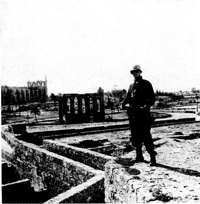
Bild 4. Schwedischer UNO-Soldat auf Wache auf der alten Stadtmauer in Famagusta, Zypern. Die venezianische Ringmauer mit dem Othello-turm ist hier die Grenze zum Gebiet der Türken innerhalb der Altstadt. Die Mauer ist 15 m hoch und 10 m breit.

Präsidenten Makarios organisiert wurde, da er sich nicht in der Lage sah, die Situation auf der Insel zu bewältigen. Im Augenblick besteht die UNFICYP außer aus schwedischen aus Verbänden aus Dänemark, Finnland, Großbritannien, Irland und Kanada. Das schwedische Kontingent wurde im Frühjahr 1966 aus Ersparnisgründen von 1000 Mann auf rund 750 herabgesetzt. Zu Anfang dieser Aktion hatte das schwedische Bataillon die Aufgabe, den großen und geländemäßig schwierigen Westteil der Insel zu überwachen. Die Lage war – und ist noch immer – hier sehr kompliziert und entzündlich. Hiervon zeugen die heftigen nationaltürkischen Fliegerangriffe im August 1964, die ausschließlich diesen Teil der Insel trafen und auch schwedische Einheiten berührten – doch ohne Todesopfer zu fordern. Ende 1964 wurde das schwedische Bataillon in den «leichteren», östlichen Teil der Insel verlegt, in das Gebiet um den später umstrittenen Hafen von Famagusta.