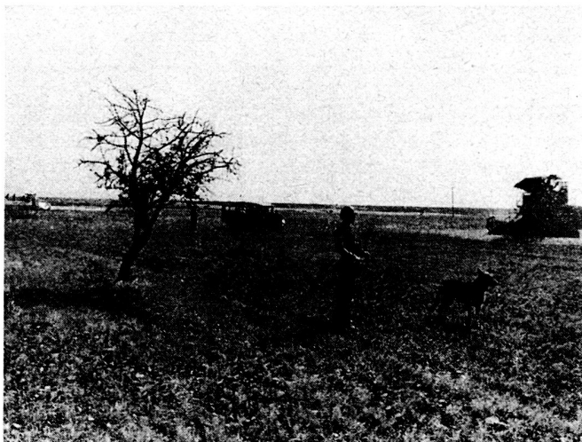
Bild 5. Schwedischer UNO-Soldat mit Wachhund als Ernteeskorte auf Zypern im Grenzgebiet zwischen griechischen und türkischen Siedlungen. Ohne solche Eskorten wagten sich die Landarbeiter nicht auf die Felder. Im Hintergrund links eines der im Text erwähnten schwedischen gepanzerten Truppentransportfahrzeuge.

Präsidenten Makarios organisiert wurde, da er sich nicht in der Lage sah, die Situation auf der Insel zu bewältigen. Im Augenblick besteht die UNFICYP außer aus schwedischen aus Verbänden aus Dänemark, Finnland, Großbritannien, Irland und Kanada. Das schwedische Kontingent wurde im Frühjahr 1966 aus Ersparnisgründen von 1000 Mann auf rund 750 herabgesetzt. Zu Anfang dieser Aktion hatte das schwedische Bataillon die Aufgabe, den großen und geländemäßig schwierigen Westteil der Insel zu überwachen. Die Lage war – und ist noch immer – hier sehr kompliziert und entzündlich. Hiervon zeugen die heftigen nationaltürkischen Fliegerangriffe im August 1964, die ausschließlich diesen Teil der Insel trafen und auch schwedische Einheiten berührten – doch ohne Todesopfer zu fordern. Ende 1964 wurde das schwedische Bataillon in den «leichteren», östlichen Teil der Insel verlegt, in das Gebiet um den später umstrittenen Hafen von Famagusta.