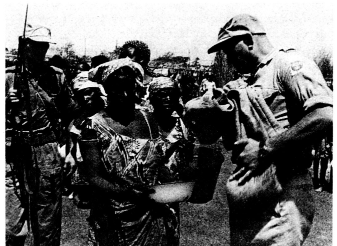
Bild 3. Schwedische Soldaten verteilen Lebensmittel an Flüchtlinge in dem von den Schweden verwalteten Balubalager in der Nähe von Elisabethville, 1961. In dem Lager befanden sich zeitweise mehr als 40 000 Flüchtlinge.

1964 das letzte schwedische Kongobataillon zurückgeführt wurde, hatte Schweden gleichzeitig drei UNO-Bataillone im Einsatz: außer im Kongo in Gaza und seit April auch auf Zypern.