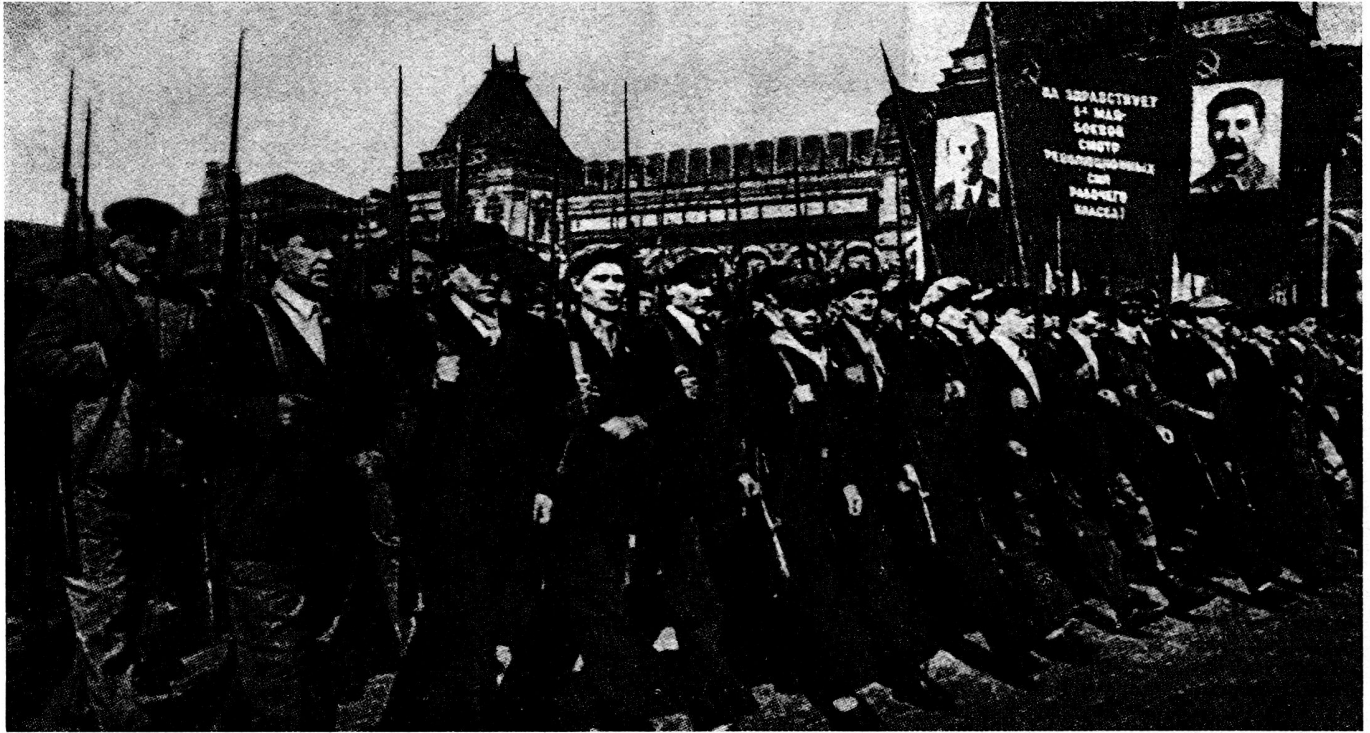
Bild 3. Maiparade 1941 in Moskau.

eine Antwort auf seine besorgte Fragen nach den «Gründen der deutschen Unzufriedenheit» zu geben. Aber als er in seine Residenz zurückkehrte, lag die Anweisung Ribbentrops vor, den sowjetischen Außenminister unverzüglich aufzusuchen und ihm, «ohne sich in irgendwelche Diskussion einzulassen», mitzuteilen, daß «im Hinblick auf den unerträglichen Druck der russischen Truppen an der Ostgrenze die deutsche Wehrmacht in das Sowjetgebiet einmarschiert sei» 79