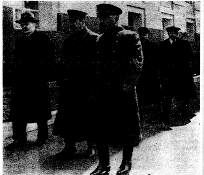
Bild 2. J. W. Stalin am 1. Mai 1941 (erste Reihe: Molotow, Woroschilow; dahinter: Malenkow, Beria).

Von einer deutschen Reaktion auf Stalins wirtschaftliche und diplomatische Gesten war freilich nichts zu merken. So gesehen, war es ein Akt reiner Verzweiflung, wenn Stalin sich genau 1 Woche vor dem deutschen Angriff entschloß, jenes berühmte «Taß»-Communique vom 14. Juni zu publizieren, das in allen sowjetischen Veröffentlichungen der Chruschtschew-Ära als das verdammenswerteste Beispiel Stalinscher Kurzsichtigkeit und