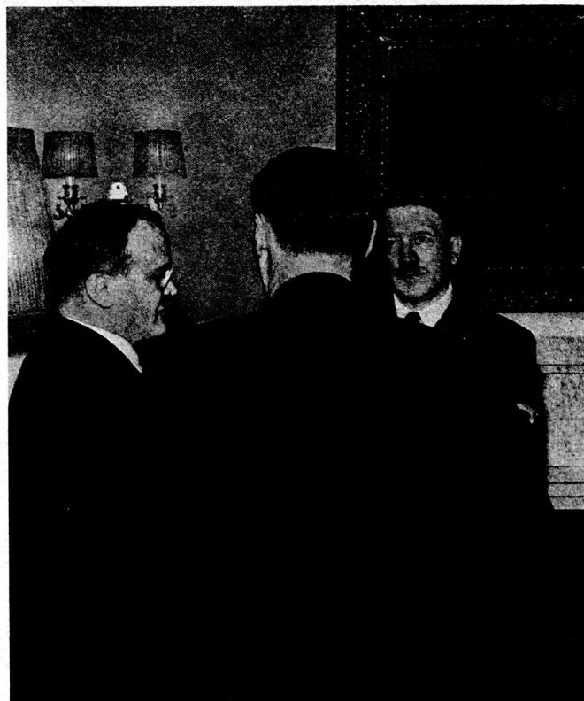
Bild 1. Molotow in Berlin, November 1940. Die Legende zu diesem im «Signal» vom Dezember 1940 erschienenen Bild lautete: «Empfang in der neuen Reichskanzlei: Der Führer empfing den Vorsitzenden des Rates der Volkskommissare der UdSSR und Volkskommissar für auswärtige Angelegenheiten, Herrn Molotow, in Gegenwart des Reichsministers des Auswärtigen, von Ribbentrop, zu längeren Aussprachen im kleinen Kreise. Herr Molotow war von dem stellvertretenden Kommissar für auswärtige Angelegenheiten, Dekanosow, begleitet. Die historische Entscheidung des Führers und Stalins für Freundschaft zwischen den beiden großen Reichen, die heute wieder Nachbarn sind, ist für die kontinentale Neuordnung Europas eines der wichtigsten Momente und von weltweiter Bedeutung.»

deshalb besser wäre, die weitere Diskussion auf den nächsten Tag zu verschieben.