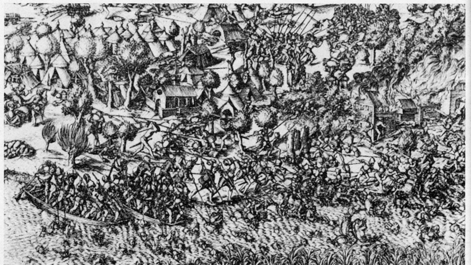
Bild 2. Nach der Schlacht bei Murten 1476 verfolgen eidgenössische Boote die in den See flüchtenden Burgunder (Radierung von Martin Martini, nach einem aus dem 15. Jahrhundert stammenden Original).