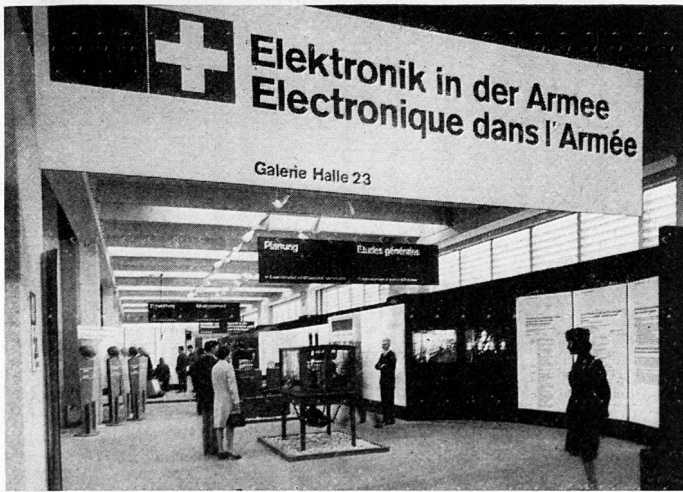
Bild 1. Die Sonderschau «Elektronik in der Armee» an der Basler Mustermesse 1968.

Unternehmen die Konzeption leitend erarbeiten und die Marschrichtung in die Zukunft maßgeblich bestimmen muß.