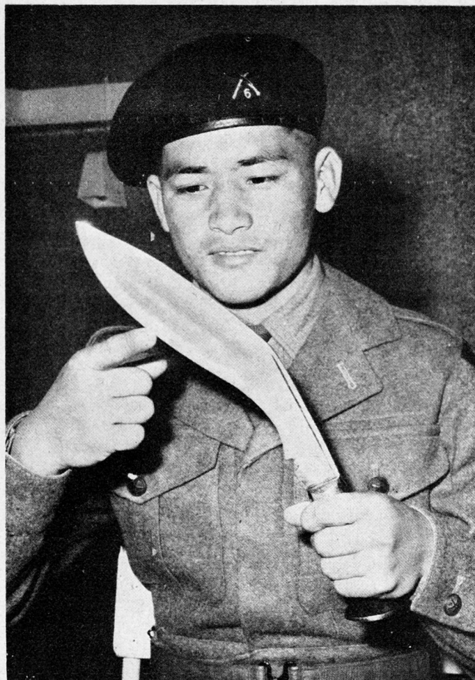
Ein Gurkha überprüft die Schneide seines «Kukri»

Das Flugzeug, der Rundfunk und vor allem das Fernsehen haben fremde, weit entfernte Länder in unsere Nähe gerückt, in die einzudringen vor wenigen Jahrzehnten nur wenigen Europäern gelungen war, so auch in das Königreich Nepal am «Dach der Welt», am Fuße der Bergriesen des Himalaja. Wohl hatten bereits seit dem Anwachsen des Alpinismus nach dem ersten Weltkrieg einzelne verwegene Forscher und Bergsteiger begonnen, die höchsten Berge im Himalaja zu erobern; dabei leistete ihnen ein Stamm mongolischer Herkunft und buddhistischer Religion, der hauptsächlich im Khumbu-Gebiet beheimatet ist – die sogenannten Scherpas – als Hochgebirgsträger unschätzbare Hilfe. Erinnert sei nur an die spätere Bezwingung des höchsten Berges der Welt, des Mount Everest, 1953 durch Sir