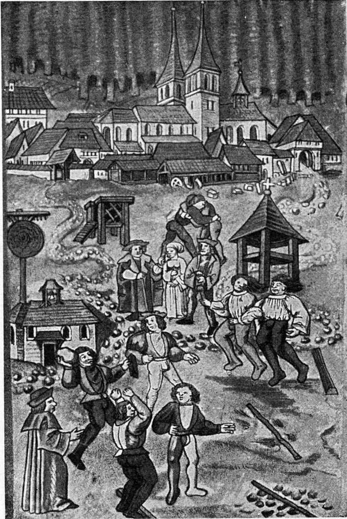
Leibesübungen auf dem Brühl bei Einsiedeln, 1508. Diebold Schilling, «Luzerner Chronik».

Im Vordergrund sind vier Wettkampfdisziplinen der altschweizerischen Leibesübungen dargestellt: Weitsprung aus Stand nach einem gesteckten Ziele, Steinstoßen, Schnellauf und Ringen. Im Hintergrund sehen wir die alte Klosteranlage von Einsiedeln.