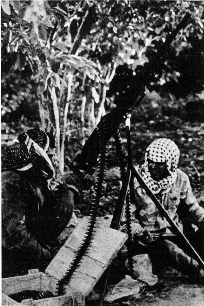
Bild 3. Flabmaschinengewehr.

sche Waffen chinesischer Lizenz, wie Maschinengewehre und Minenwerfer. Sehr beliebt bei den Guerillas ist das russische Sturmgewehr «Kalaschnikow», da es leicht, robust, handlich und für Feuerüberfälle gut geeignet ist. Aber auch «Katjuscha»-Raketen, Bazookas, Handgranaten, erbeutete israelische Waffen, englische und französische Maschinenpistolen aus dem zweiten Weltkrieg und russisch-chinesische Minen fehlen nicht in dem uneinheitlichen Waffensammelsurium, das besondere Probleme für Munitions- und Ersatzteilmachschub stellt. Schwere Waffen, wie Artillerie und Panzer, fehlen vollständig, Fliegerabwehrgeschütze sind nur wenige vorhanden, meistens werden Maschinengewehre auf behelfsmäßigen Flablafetten montiert. Der Mangel an genügenden Fliegerabwehrmitteln wird von den Guerillas bei der israelischen Luftüberlegenheit als besonders schmerzlich empfunden.