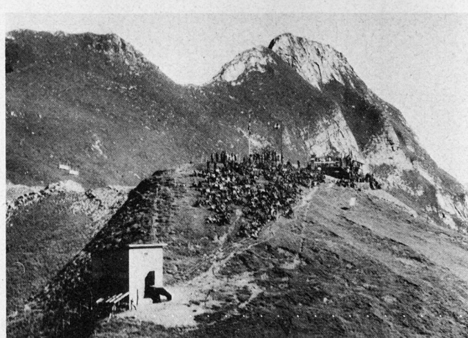
Bild 1. Aufnahme aus dem Tiefstflug mit den automatischen Kameras des «Mirage-III-RS»-Aufklärers. Der Kommandoposten auf Axalp, 2300 m ü. M.

Ferner waren zu allen Übungen die Vertreter von Presse, Radio und Fernsehen geladen worden.