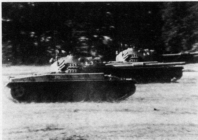
Bild 3. Panzer und Panzergrenadiere haben gemeinsam eine Krete genommen.