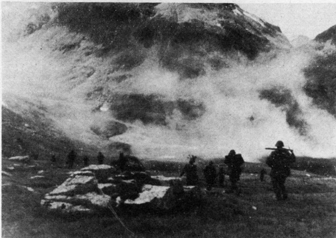
Bild 4. Gebirgsinfanterie im Vormarsch

Die Übungen wurden durch eine Anzahl höherer Offiziere, Vertreter militärischer und ziviler Behörden und einer ansehnlichen Zahl weiterer Gäste besucht. An einzelnen Übungen nahmen auch die in Bern akkreditierten Militärattachés teil.