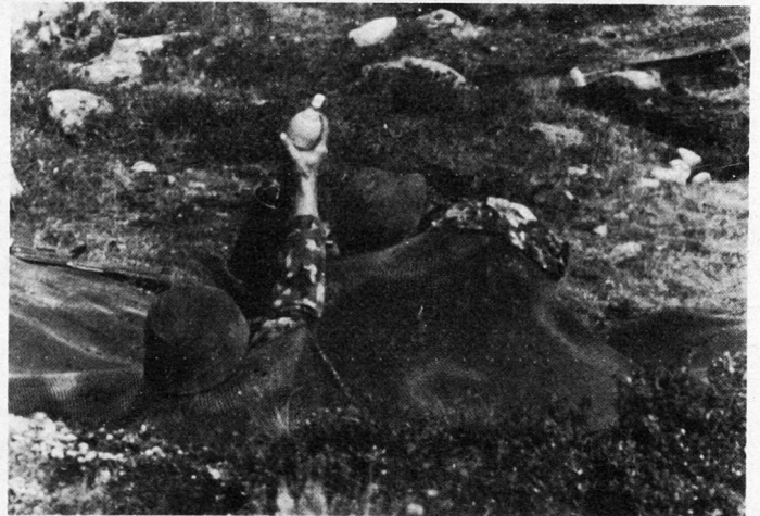
Bild 5. Einsatz des Mw 8,1 cm