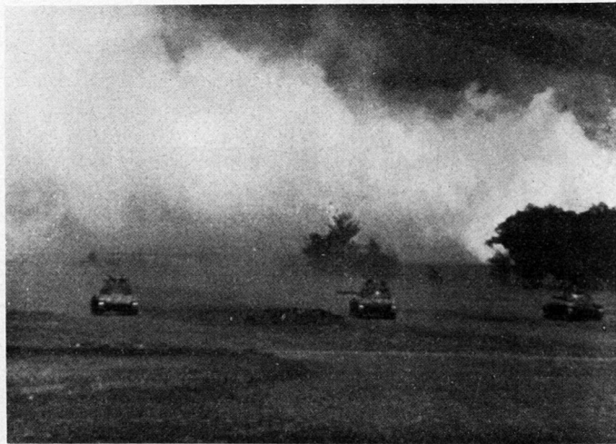
Bild 1. Einsatz von Panzern im Schutze der Nebelwand

Es ging vor allem darum, klar zum Ausdruck zu bringen, daß sich der Gegenschlag gegen den in den Abwehrraum eingedrungenen Gegner richtet, während es sich beim Gegenangriff um die Wiederinbesitznahme von verlorengangenen Gelände handelt. Die gezeigte Übung demonstrierte diese beiden Kampf-formen äußerst klar und prägnant. Gleichzeitig konnte mit dem Einsatz von zwölf «Mirage»- Flugzeugen gezeigt werden, daß derartige Aktionen eines Luftschirmes bedürfen und daß unsere Flugwaffe neben dem Erdeinsatz vor allem Aufgaben des Raumschutzes und der indirekten Unterstützung übernehmen muß. Eindrücklich waren neben dem äußerst flüssig vorgetragenen Vorstoß der Panzer und Panzergrenadiere die geschossenen Feuer des Hb Rgt 4.