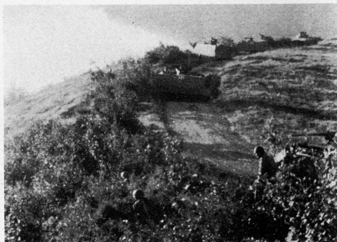
Bild 2. Pz 61 im Vormarsch