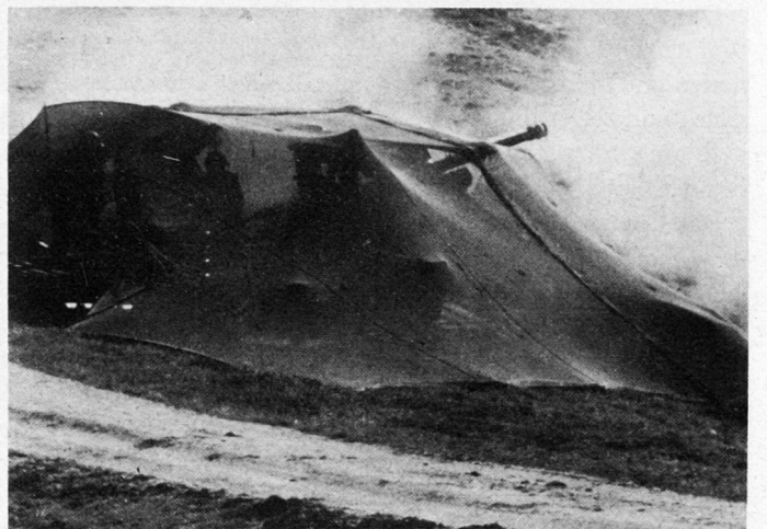
Bild 7. Eine Haubitze in Feuerstellung