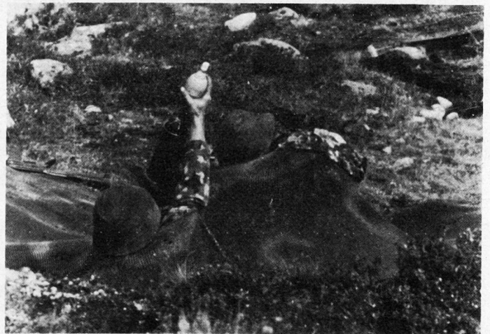
Bild 5. Einsatz des Mw 8,1 cm