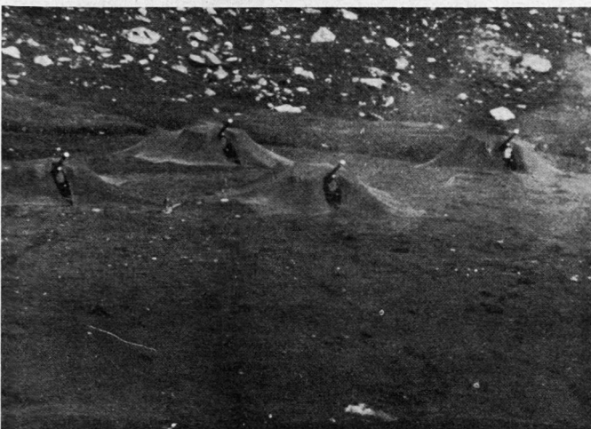
Bild 6. Getarnte Stellung einer Haubitzen-Batterie