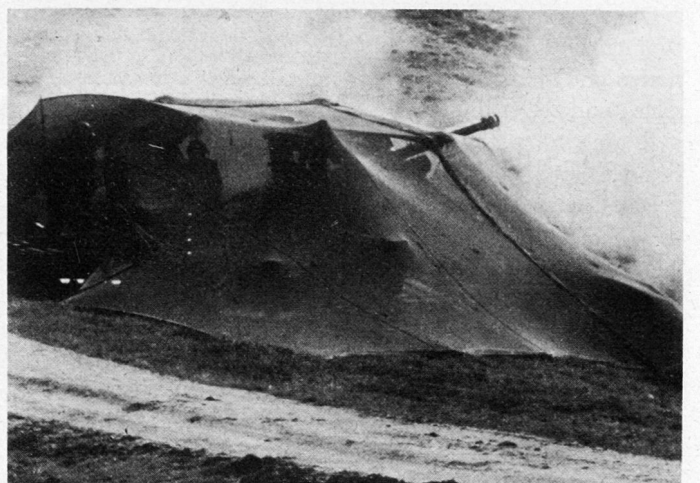
Bild 7. Eine Haubitze in Feuerstellung