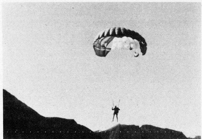
Bild 6. Absprung eines Fallschirmjägers

Den dritten Teil der Vorführungen bestritt die I. Fsch Gren Kp. Die Grenadiere zeigten ihre Sprungtechnik aus dem Hoch- und Tiefflug in voller Kampfausrüstung im Gebirge. Ihre Sprünge waren äußerst genau, wozu natürlich auch die günstigen Windverhältnisse beigetragen haben mögen.