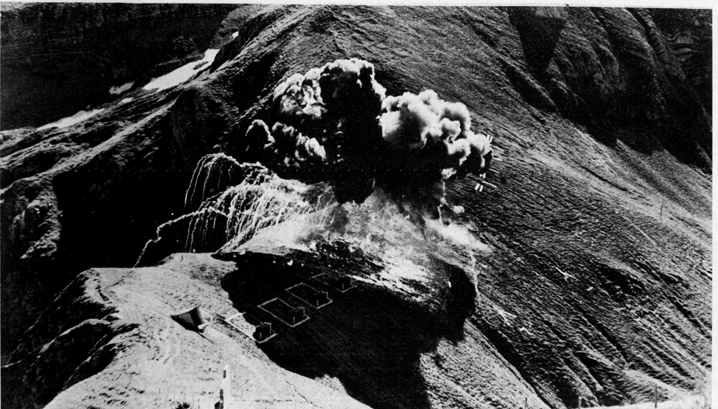
Bild 4. Explosion einer Feuerbombe auf dem Grätli.

dieser Verband eine sehr beachtliche Schießfertigkeit. Den ersten Teil der Demonstration beschloß sodann ein Kanonenangriff mit vier «Mirage III S». Diese Flugzeuge zeigten anschließend ihre hohe Beweglichkeit und ihr enormes Beschleunigungsvermögen, Eigenschaften, die insbesondere auch für den Luftkampf von entscheidender Bedeutung sind.