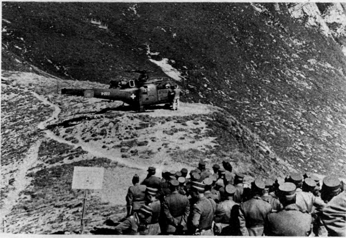
Bild 2. Helikopter-Start- und -Landeplatz auf Axalp.