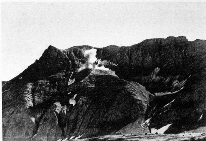
Bild 5. Bombenangriffe auf Ziel A.