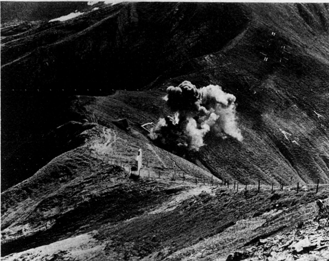
Bild 3. Angriff mit Raketen auf eine Fahrzeugkolonne.