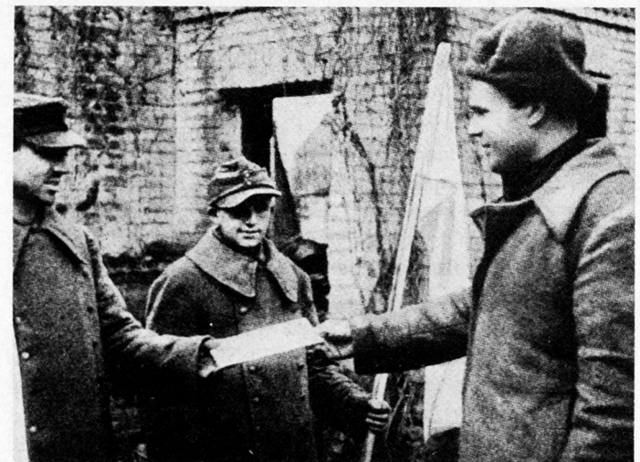
Bild 6. Im Raum Saporoschje stand im Herbst 1943 die 123. Inf. Div. unter der Führung des Generalmajors Rauch, um die Rote Armee am Überschreiten des Dnjeprs zu hindern. Im Namen des «Nationalkomitees Freies Deutschland» sollte nun ein Brief von General von Seydlitz an General Rauch übersandt werden, der «die politische und militärische Lage erläutern und zur vaterländischen Tat auffordern sollte». Die folgenden Bilder werden im Westen erstmals publiziert. Der Frontbevollmächtigte des «Nationalkomitees», ein deutscher Oberleutnant, übergibt zwei deutschen Parlamentären den Brief an Generalmajor Rauch.