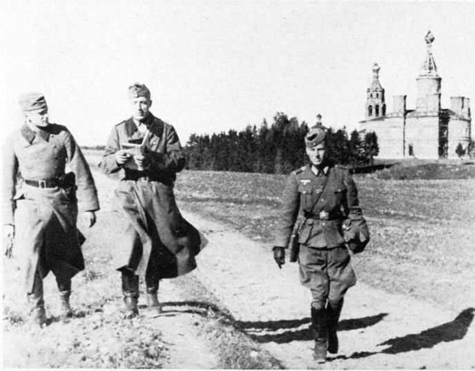
Bild 2. Auf den Waldaihöhen im September 1941.