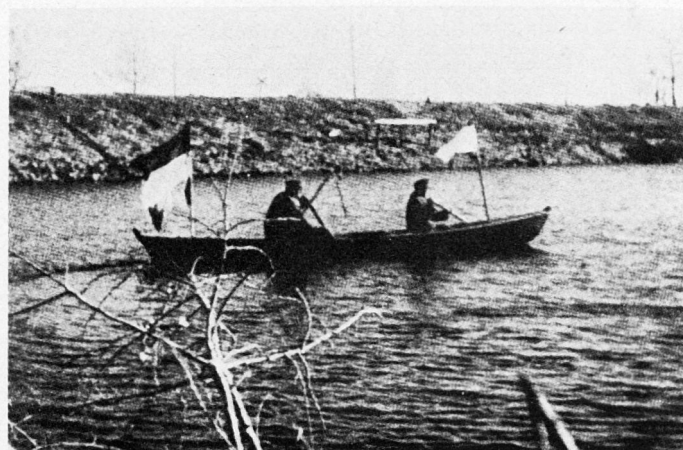
Bild 8. Überfahrt der Parlamentäre.