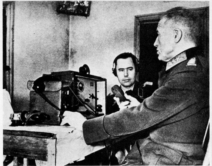
Bild 4. General Walther von Seydlitz-Kurzbach wendet sich an die eingeschlossenen deutschen Soldaten im Kessel von Korsun-Schewtschenkowski (1944).

Noch nie waren im Zweiten Weltkrieg bis dahin so zahlreiche deutsche Soldaten und Offiziere in Gefangenschaft des Gegners geraten. Und noch nie war ihr Ende mit so viel physischem und moralischem Elend verbunden. Stalingrad war nicht einfach Schauplatz einer beliebigen Niederlage geworden, sondern ein Mahnmal, eine Zäsur, welche den weiteren Verlauf der Kriegseignisse in jeder Hinsicht prägte – nicht zuletzt das Schicksal der 100 000 Überlebenden dieser Katastrophe. Nun befanden sie sich in den Händen der Roten Armee, in der Gewalt jener Armee, gegen die Hitler keinen «regulären Krieg», sondern – wie er am