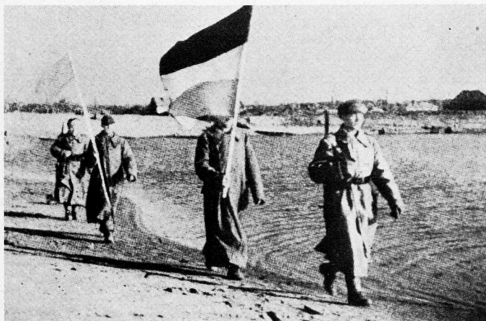
Bild 7. Die zwei deutschen Parlamentäre gehen mit einer deutschen Fahne (kein Hakenkreuz!) und mit einer weißen Fahne zum Boot.

General Walther von Seydlitz-Kurzbach gehörte nicht zu ihnen. Er wurde im Mai 1950 von der NKWD verhaftet, nachdem man vergebens versucht hatte, ihn für die Ostzone Deutschlands beziehungsweise seine Bereitschaft für verschiedene Ergebenheitstelegramme an Stalin zu gewinnen. Gegen ihn