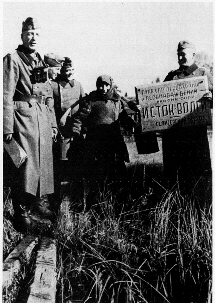
Bild 3. An der Quelle der Wolga (Waldaihöhen). Inschrift auf Tafel: «Forsthauptverwaltung: Quelle der Wolga».

Am 10. Januar 1943 begann die Rote Armee mit der systematischen Vernichtung der Eingeschlossenen. Der Kessel schrumpfte rapid zusammen. Am 19. Januar rief Paulus alle erreichbaren Generäle zu sich, um sich über die Lage an den Frontabschnitten persönlich orientieren zu lassen. Die übereinstimmende Auskunft lautete: Zustände bei allen Truppen in jeder Hinsicht katastrophal! Umsonst wandte sich darauf Paulus erneut an Hitler und bat um Handlungsfreiheit hinsichtlich einer ehrenhaften Kapitulation. Hitlers Antwort: «Kapitulation ausgeschlossen. Kampf bis zur letzten Patrone!»