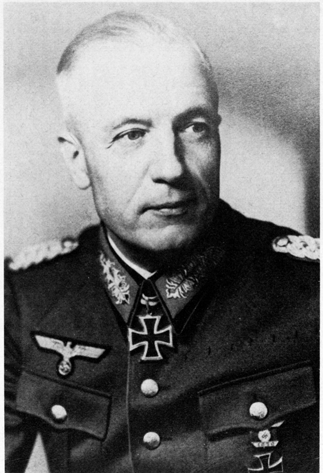
Bild 1. General der Artillerie Walther von Seydlitz-Kurz bach.

Doch es sollte anders kommen. Am 19. November 1942 brach die große Winteroffensive der Roten Armee los, und 4 Tage danach saßen mehr als 250 000 deutsche, rumänische und kroatische Soldaten, 2 ganze Armeen, in einem riesigen Kessel. «Ausbrechen oder sich einigeln?» – dies war die Frage, die sich damals die Verantwortlichen im Bereich der 6. Armee bezie-