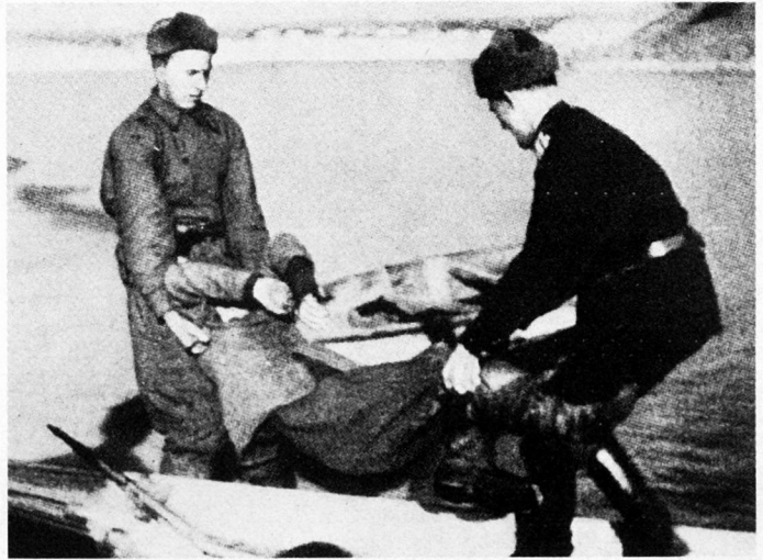
Bild 9. Sie werden mit Schüssen gewarnt, sodann unter Beschuß genommen. Einer der Parlamentäre fällt, der andere kehrt unverrichteter Dinge zurück.

Seither sind viele Jahre vergangen. Der General lebt zurückgezogen in Norddeutschland. Wird er einst seine Memoiren veröffentlichen? Wir würden es um so mehr begrüßen, als seine Taten im Westen vielenorts verkannt, im Osten völlig verschwiegen werden (vergleiche zum Beispiel «Neues Deutschland», 11. Januar 1970). General Walther von Seydlitz-Kurzbachs Beispiel zeugt davon, daß es auch unter Hitler Generäle gab, die zu selbständigem Handeln bereit waren, bittere persönliche Konsequenzen nicht scheuten und, wenn nötig, auch ihr Leben für ein neues, in jeder Hinsicht demokratisches Deutschland hinzugeben bereit waren.