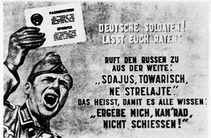
Bild 5. Flugblatt des Nationalkomitees «Freies Deutschland» (1944).