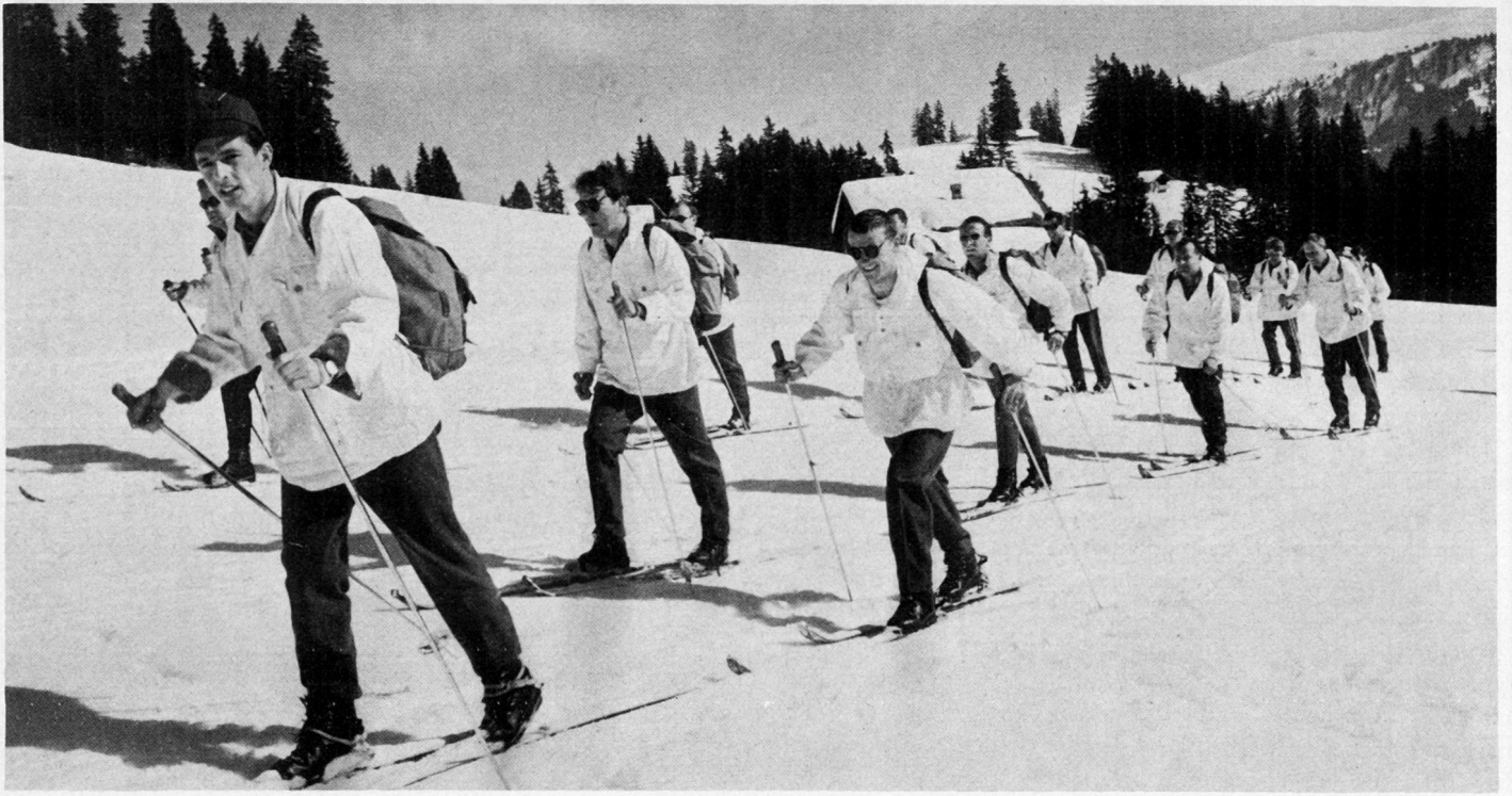
Wehrsport 1970: Freiwilliger Wintergebirgsmarsch mit Mindestanforderungen.