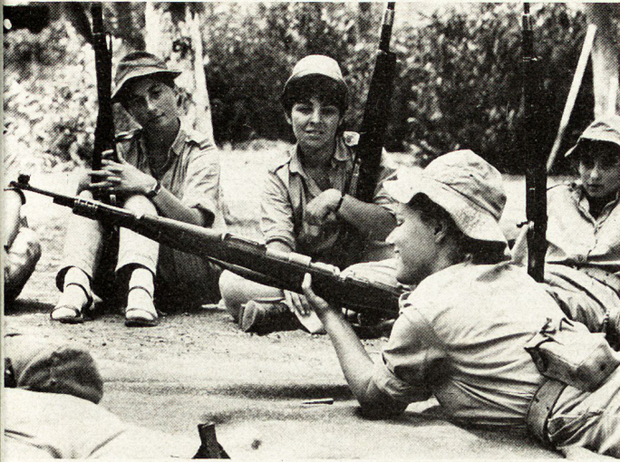
Bild 3. Die frischgebackenen Soldatinnen handhaben das Gewehr zuerst noch etwas skeptisch.

nächsthöheren Vorgesetzten herzustellen. Auch persönliche Probleme werden besprochen, und die Mädchen erhalten wenn immer möglich die Gelegenheit, die Nächte zu Hause zu verbringen. Das gibt ihnen das Gefühl einer individuellen Betreuung, und sie sehen sich nicht einfach zu Soldat X oder Y degradiert.