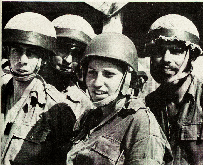
Bild 4. Ein kameradschaftliches Verhältnis herrscht bei den männlichen und weiblichen Fallschirmabspringern.

Es gibt keine Waffengattung und keine Einheit in der israelischen Armee, die keine Mädchen aufweist. Sie teilen mit ihren männlichen Kollegen dieselben Rechte und Pflichten. Für die täglichen Arbeiten können die Soldatinnen einem männlichen Kommandanten unterstehen; ihr direkter Vorgesetzter aber ist ein weiblicher Offizier des Chen. Die Chen-Chefkommandantinnen überwachen die verschiedenen Dienste der Mädchen in ihren Einheiten und prüfen Beförderungsgesuche. Sie bilden