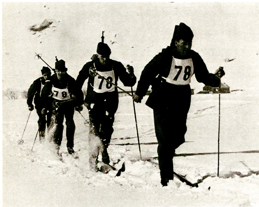
Der Milizcharakter unserer Armee wird auch durch die mannigfaltige außerdienstliche Tätigkeit auf freiwilliger Basis unterstrichen.

Es darf als erwiesen gelten, daß unsere Ausbildung, gesamthaft gesehen, einen bemerkenswerten Stand erreicht. Die Intensität der Arbeit übertrifft das in unseren Nachbarländern Übliche. Diese Arbeitsintensität, der große Einsatzwille von Kader und Truppe, ja das außergewöhnliche Potential an «bonne volonté», auf das wir mindestens bei der WK/EK-Truppe zählen können, und – in diesem Zusammenhang – namentlich das außerdienstlich von den Kadern bewältigte Arbeitspensum sind die Erklärung dafür, daß wir mit so kurzen Ausbildungsperioden auskommen. Bei steigenden Anforderungen an alle Stufen, die mit der zunehmenden Technisierung sowie neuen Kampfverfahren zusammenhängen, werden wir diese knappen Ausbildungszeiten in Zukunft nur unter der Bedingung verantworten können, daß von den Anlagen und dem Material her optimale Bedingungen geschaffen werden. Der gern gerügte Leer-