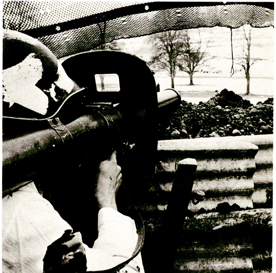
Mit dem Raketenrohr können Panzer bis auf eine Distanz von 200 bis 300 m bekämpft werden. Eine neue Munition soll die Einsatzdistanz erhöhen.