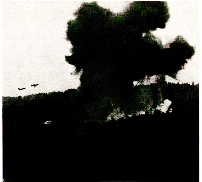
Bild 1. Zwei G 91-Kampfflugzeuge werfen Feuerbomben.