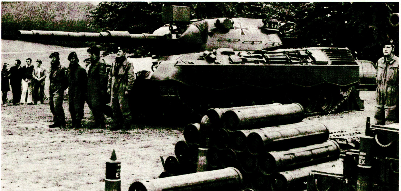
Bild 2. Kampfpanzer «Leopard» mit Mannschaft nach der Gefechtsübung. Bewaffnung: Bordkanone 105 mm, 1 Fliegermaschinengewehr