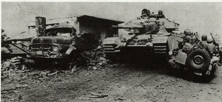
12. Oktober 1973: Israelische Truppen auf dem Weg zum Golan

– Ein Hinweis auf die Richtigkeit unserer Methode, Gegenschläge sorg-