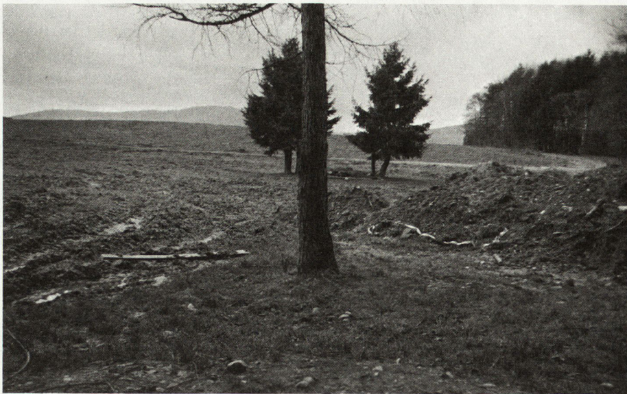
Bild 1. Blick aus Raketenrohrstellung von «Birke» nach Kammlinie «Krete».

12 Sekunden. Mit geschlossenem Dekel fährt er 10 bis 30 km schnell. Um schußbereit zu sein, braucht er etwa 15 Sekunden. Minen und Hindernisse werden ihn zusätzlich verlangsamen. Der Entscheidungskampf ist ein Kampf von Sekunden und Minuten. Es gilt, innert kürzester Zeit mit sämtlichen Panzerabwehrwaffen möglichst viele Treffer anzubringen.