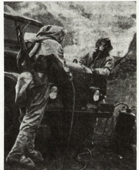
Bild 2. Vollständige Entstrahlung eines Automobils mit Hilfe des Entgasungssatzes DKW