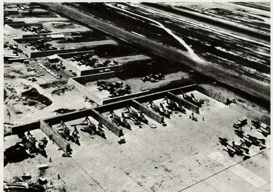
Bild 3. Feuerunterstützung durch taktische Lufteinsätze: F-4C-Phantom in Da-Nang.