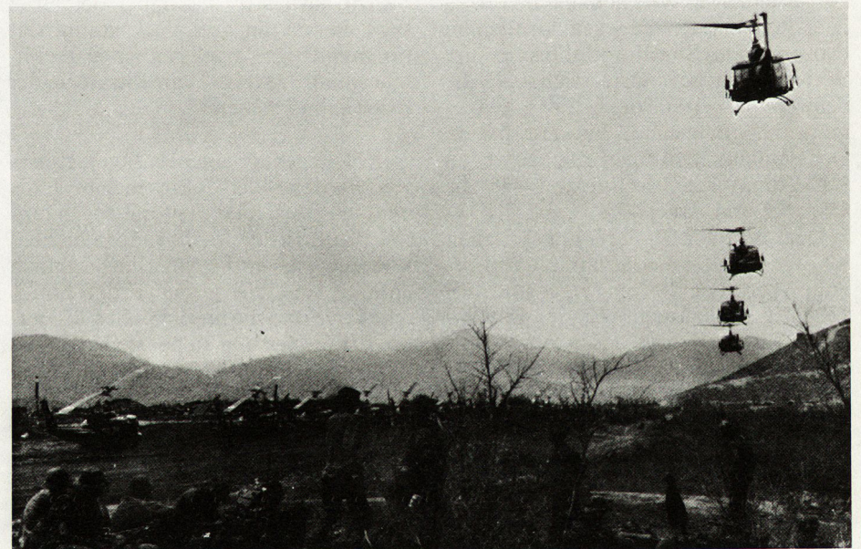
Bild 2. Helikopterbereitstellung, um Verbände in das Kampfgebiet einzufügen.