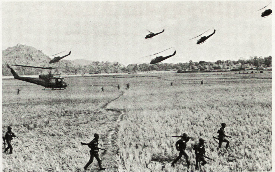
Bild 1. Von amerikanischen UH-1-Helikoptern gelandete südvietnamesische Truppen im Mekong-Delta.