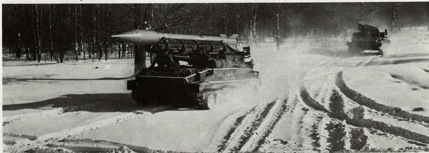
Panzerraketenwerfer «Frog 3», Reichweite 36 km, kann mit atomarem Gefechtskopf oder C-Ladung ausgerüstet werden.