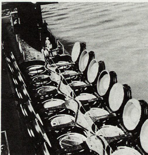
Blick in die 16 Abschußröhren für «Poseidon»-Raketen eines amerikanischen Atom-U-Bootes.