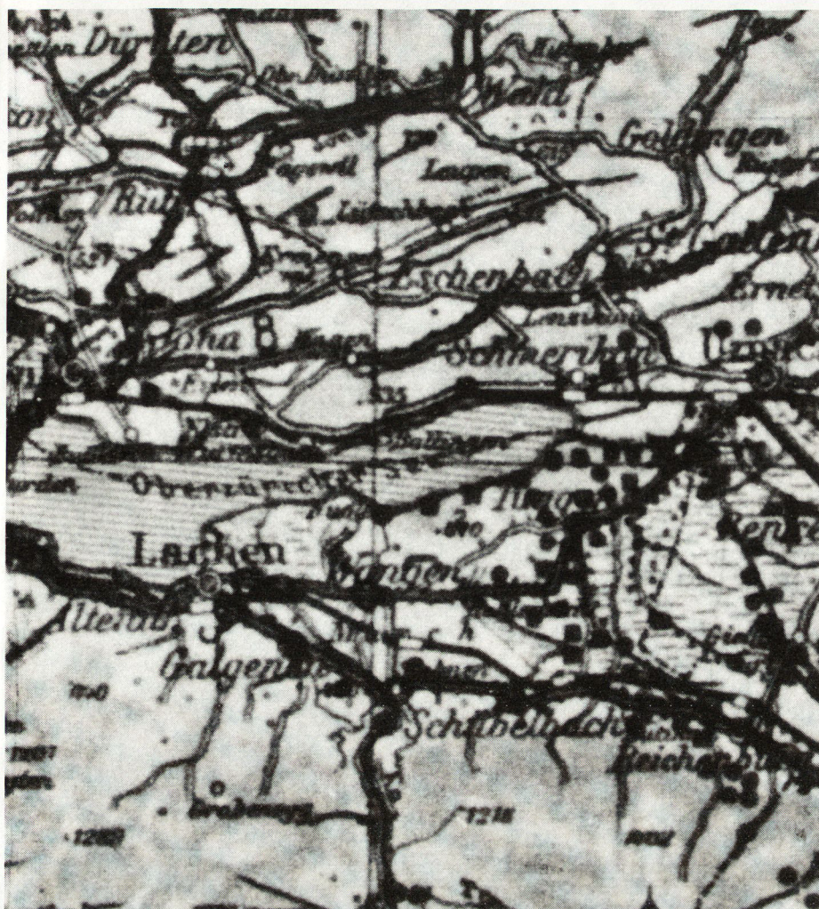
Bild 1. Vergrößerung aus: «Befestigungskarte Schweiz, Anlage 7». Die Eintragung der Befestigungsanlagen des deutschen Oberkommandos erfolgte auf Grund von Meldungen, die zum großen Teil bestätigt beziehungsweise durch Bilder belegt sind.

den ortsfesten Versorgungseinrichtungen und deren Standorten, handle es sich um Motorfahrzeugparks, Munitionsdepots, Verpflegungsmagazine, Kriegslazarette, Pferdekuranstalten oder Einheiten der Feldpost.