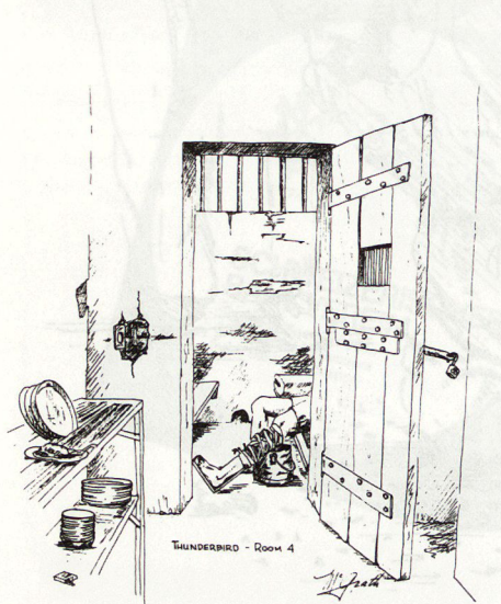
Bild 2. Blick in die Zelle eines amerikanischen Kriegsgefangenen in Vietnam.

«1. Ich bin ein amerikanischer Soldat. Ich diene in den Streitkräften, die unser Land und unsere Lebensweise schützen. Ich bin bereit, dafür mein Leben hinzugeben.