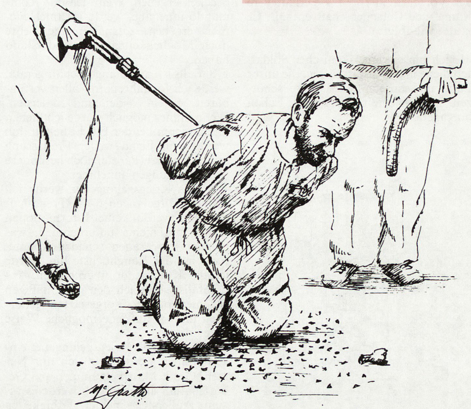
Bild 1. Erzwingen von Aussagen durch Folterungen, denn der Kriegsgefangene wird als Informationsquelle, Propagandainstrument und politisches Druckmittel mißbraucht.

Dieses typische Kriegsgefangenen-schicksal liegt keine 10 Jahre zurück.