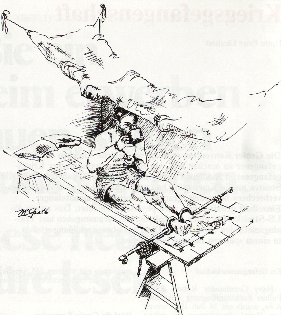
Bild 3. Viele verbrachten Wochen und Monate in dieser Stellung.

2. Ich werde mich niemals aus freien Stücken ergeben. Wenn ich das Kommando innehabe, werde ich mich niemals ergeben, solange meine Leute noch Möglichkeiten zum Widerstand haben.