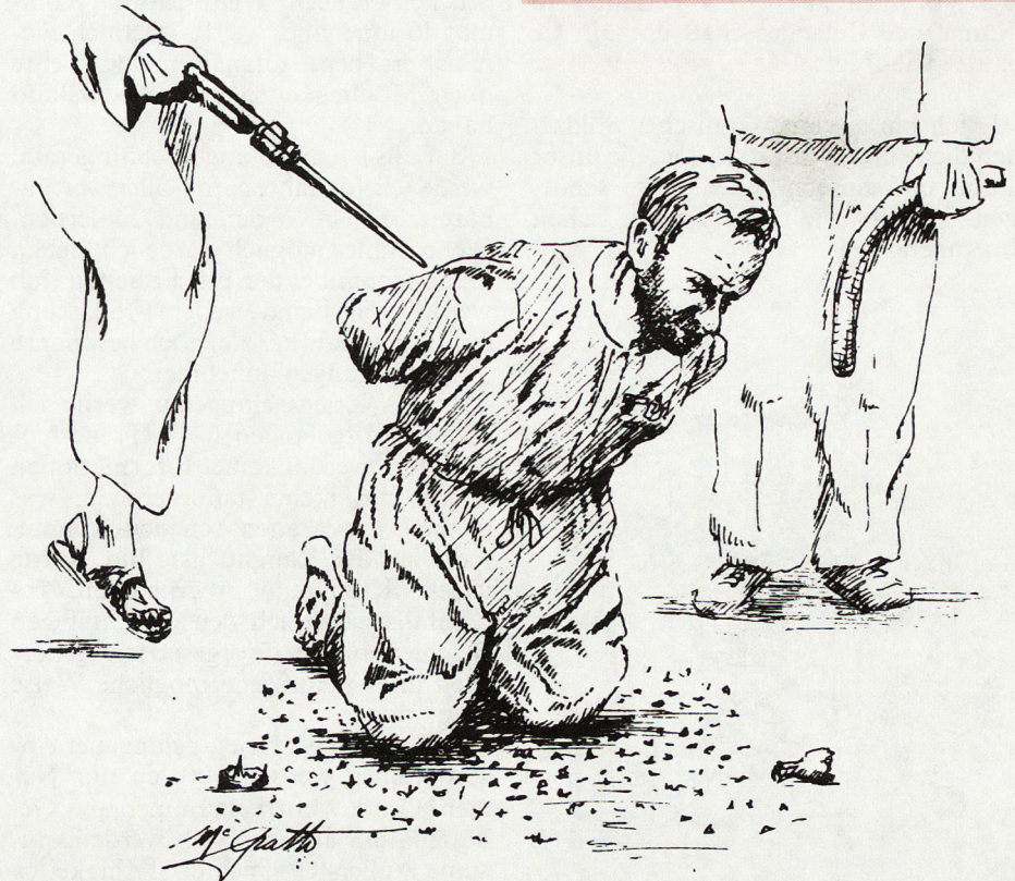
Bild 1. Erzwingen von Aussagen durch Folterungen, denn der Kriegsgefangene wird als Informationsquelle, Propagandainstrument und politisches Druckmittel mißbraucht.

Dieses typische Kriegsgefangenen-schicksal liegt keine 10 Jahre zurück.