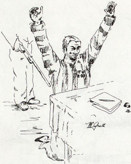
Bild 5. Verhör, mit dem Ziel, Informationen zu beschaffen, vor allem aber zwecks physischer und psychischer Unterwerfung und Versklavung der Gefangenen.

wechslung aufzuklären, gab der Gefangene oft wertvolle Informationen preis.