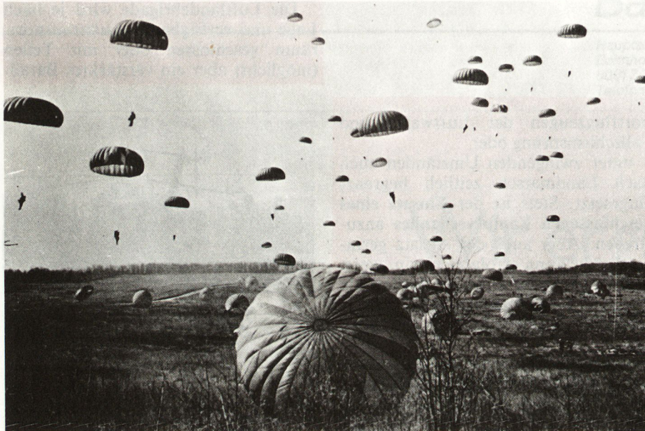
Bilder 32, 33 und 34. Fallschirmsprungeinsatz, Vorbereitung und Absprung

ion) im allgemeinen nur über eigenem Gebiet angefliegen und in Luftlandeoperationen eingesetzt. Unter Luftlandeoperation ist zu verstehen der durch die Luftwaffe gesicherte Lufttransport von Kampftruppen, die mit einem Gefechtsauftrag in der vorgesehenen Gefechtsgliederung in ihrem Einsatzraum so gelandet werden, daß sie den Kampf entweder allein oder im Zusammenwirken mit anderen Verbänden unmittelbar aufnehmen können.