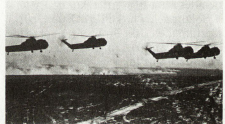
Bilder 30 und 31. Transport von Luftlandejägern in Hubschraubern