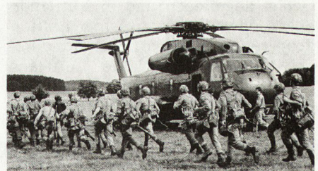
Bilder 27, 28 und 29. Luftlandejäger bei der Vorbereitung des Lufttransportes mit Hubschraubern