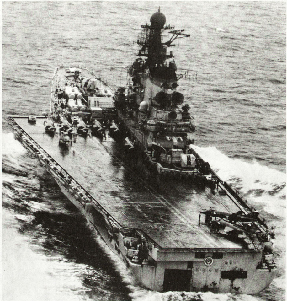
Royal Air Force, No. 42 Squadron, St. Mawgan.

Das Bild zeigt den russischen Flugzeugträger «Kiew» auf Fahrt im Nordatlantik. Gut erkenntlich sind auf dem Flugdeck einige Träger-Kampfflugzeuge vom Typ Yak-36 Forger (Senkrecht/Steil-Start und -Landung) sowie Kamov-Ka-25-Hormone-Helikopter zur U-Boot-Bekämpfung. Am