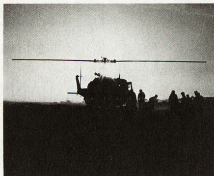
Bild 3: Israelischer Sanitätshelikopter bei der Bergung von Verwundeten.

Syrien verfügt über etwa 80 Mig-17, 220 Mig-21, 60 Mig-23 und 50 Su-7. Die Zahl der Mig-23 liegt an der oberen Grenze. Die syrischen Piloten haben in der Ausbildung bisher ein run-