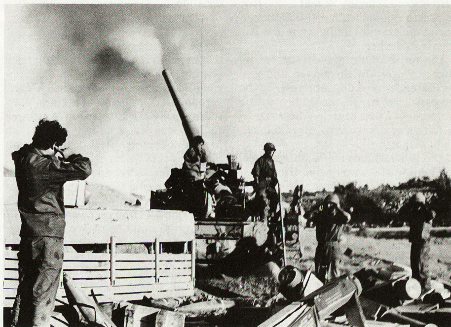
Bild 1: Israelische M-107-Selbstfahrlafette im Einsatz. Kaliber 175 mm, Reichweite 32 km.

In der Zone I bleibt der Kampfpanzer das beherrschende Element, wenn auch sein Einsatz modernen Abwehrmitteln