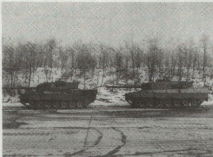
Bild. KPz Leopard 1 (links) und Leopard 2 Serienausführung rechts

Der Zeitplan für den Anlauf der Serienfertigung konnte bisher exakt eingehalten werden. Die Panzertruppe der Bundeswehr soll den ersten Leopard 2 termingemäss im Oktober 1979 übernehmen. Die Bundesregierung wird insgesamt 1800 Leopard 2 beschaffen, die Fertigung wird sich bis in das Jahr 1986 erstrecken.