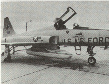
Der F-5E mit 30-mm-Kanonenbehälter von General Electric. (Siehe auch ASMZ 12/78 Seite 661: 30-mm-Kanonenbehälter KCA von Oerlikon.)

Bekanntlich ist der F-5E mit zwei für den Luftkampf ausgelegten 20-mm-Kanonen ausgerüstet. Um die Kampfkraft auch gegen gepanzerte Erdziele zu erhöhen, führt die Firma Northrop Versuche durch mit einer neuen 30-mm-Kanone von General Electric (Kadenz: 2400 Schuss pro Minute). Die Waffe ist in einem stromlinienförmigen Behälter untergebracht, der an der Waffenstation unter dem Rumpf angehängt werden kann. pb