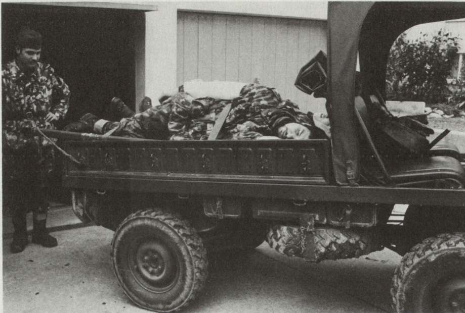
Bild 1. San Dienst. Bau von Verwundetennest und Verwundetentransport auf Haflinger.

kommandanten erledigt der Feldweibel einen Haufen Kleinarbeit zugunsten der Einheit, um dadurch seinen Chef zu entlasten.