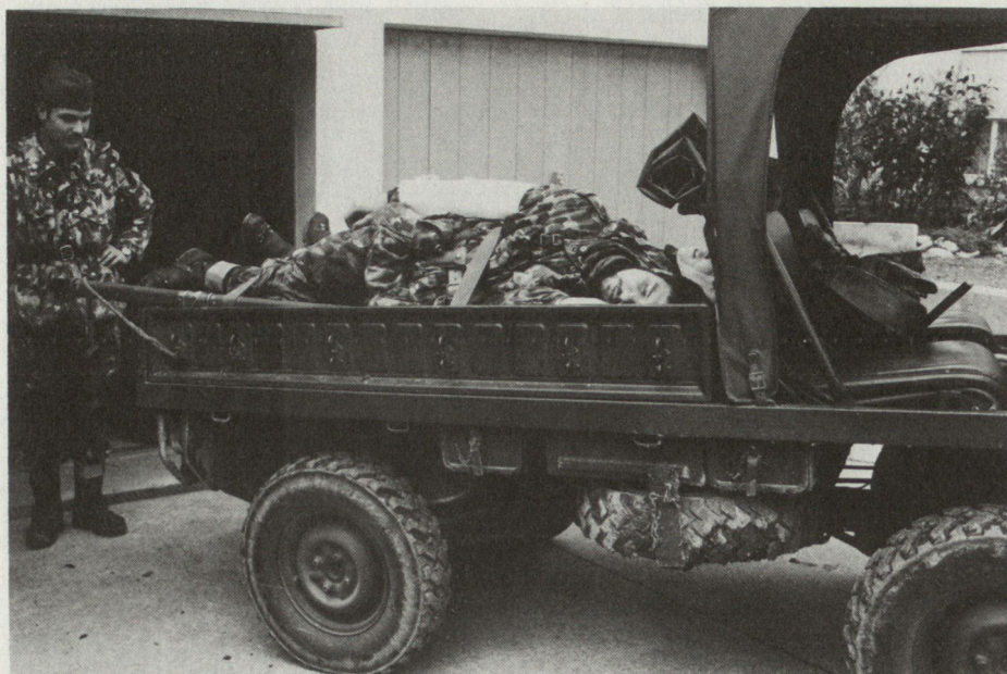
Bild 1. San Dienst. Bau von Verwundetennest und Verwundetentransport auf Haflinger.

kommandanten erledigt der Feldweibel einen Haufen Kleinarbeit zugunsten der Einheit, um dadurch seinen Chef zu entlasten.