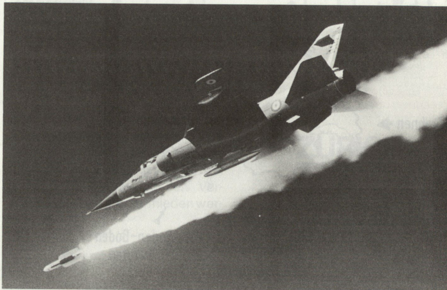
Mirage F1 (Frankreich) schießt Luft-Luft-Lenkwaaffe vom Typ Matra Super 530 ab.

Der Einsatz von Drohnen brachte den israelischen Truppen im Libanonkrieg und speziell im Bekaa-Tal spektakuläre Erfolge. Dank der Mikroelektronik öffnet sich ihrem Einsatz ein weites Feld von Möglichkeiten. So wird man versuchen, mit ihnen künftig Aufklärungs-, Feuerleitungs- und Zielbezeichnungsaufgaben zu lösen. Dank