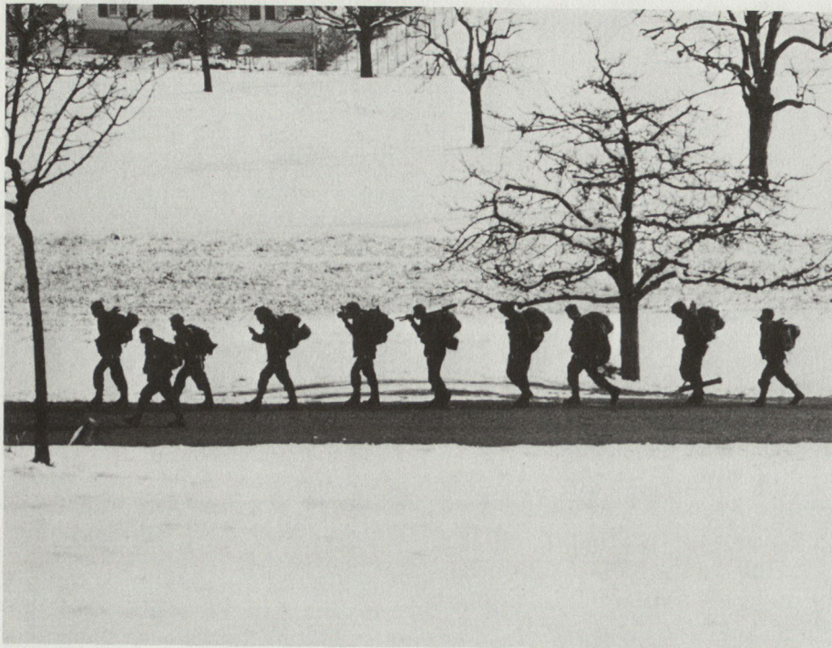
Bild 1. Unsere militärische Landesverteidigung ist das Modell eines nicht-aggressiven Wehrsystems.

Damit ist das Stichwort für die schweizerische Verteidigungskonzeption gegeben. Sie stützt sich auf die Idee der Raumverteidigung . Darin spielen die statischen Bestandteile eine tragende Rolle: permanente Hindernisse, in Festungen eingebaute Waffen, Unterstände für die Truppe, Zerstörungsvorbereitungen an Brücken und andern empfindlichen Teilen des Verkehrsnetzes – lauter Dinge also, die nur an ihrem Standort einen militärischen Nutzen erbringen und deshalb keinen Menschen jenseits der Landesgrenze bedrohen.