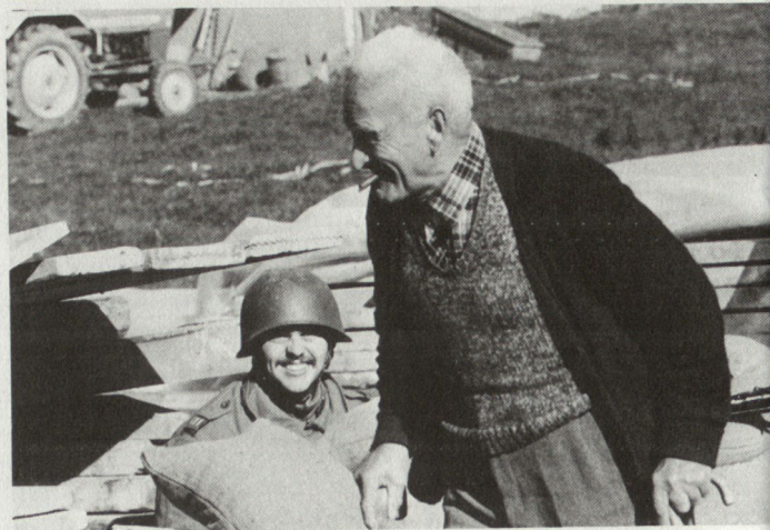
Bild 4. Begegnung zwischen alt und jung.

15.20 – 15.28 Heliflug Trin Mulin-Kaserne Chur 15.40 – 17.30 Autofahrt Chur-Zürich TV-Studio 17.45 – 18.30 Technische Filmbearbeitung 18.30 – 19.30 Redaktionelle Arbeit 19.30 TV-Ausstrahlung