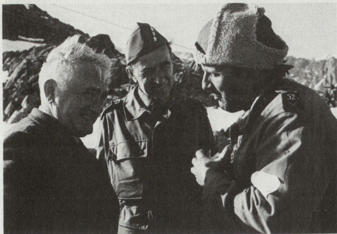
Bild 3. Der Chef EMD informiert sich über den Seilbahnbau am Scalettapass.