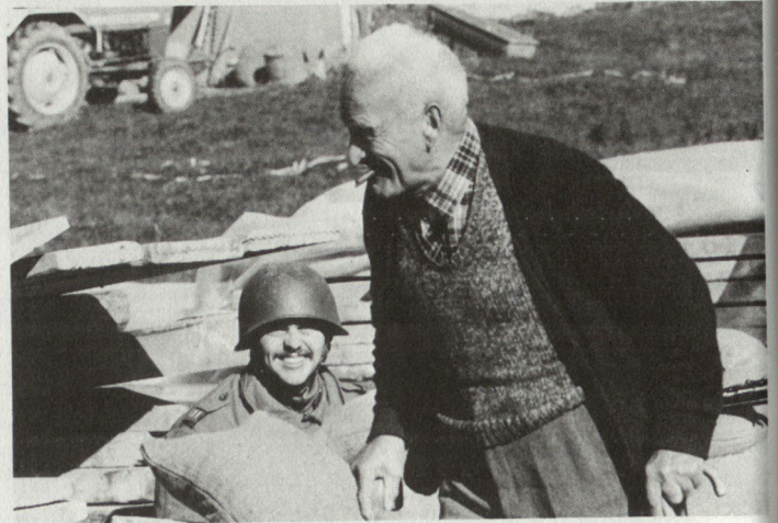
Bild 4. Begegnung zwischen alt und jung.

15.20 – 15.28 Heliflug Trin Mulin-Kaserne Chur 15.40 – 17.30 Autofahrt Chur-Zürich TV-Studio 17.45 – 18.30 Technische Filmbearbeitung 18.30 – 19.30 Redaktionelle Arbeit 19.30 TV-Ausstrahlung