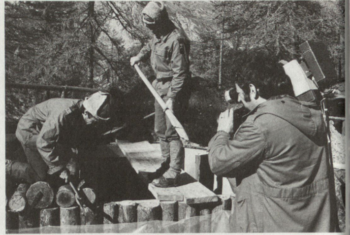
Bild 2. TV-Equipe beim Bau eines Unterstandes.