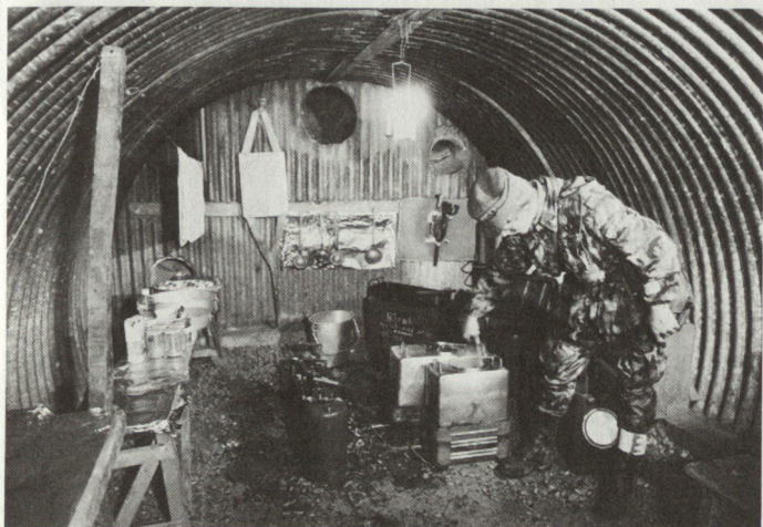
Bild 4. Truppenverpflegung aus der Kriegsküche.