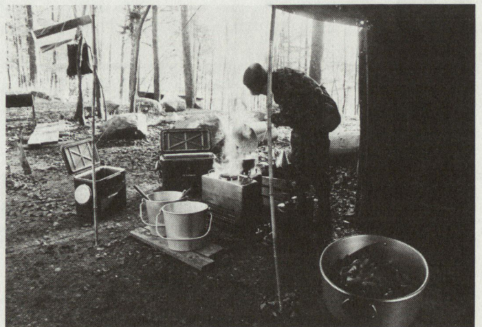
Bild 5. Truppenverpflegung aus der Feldküche.