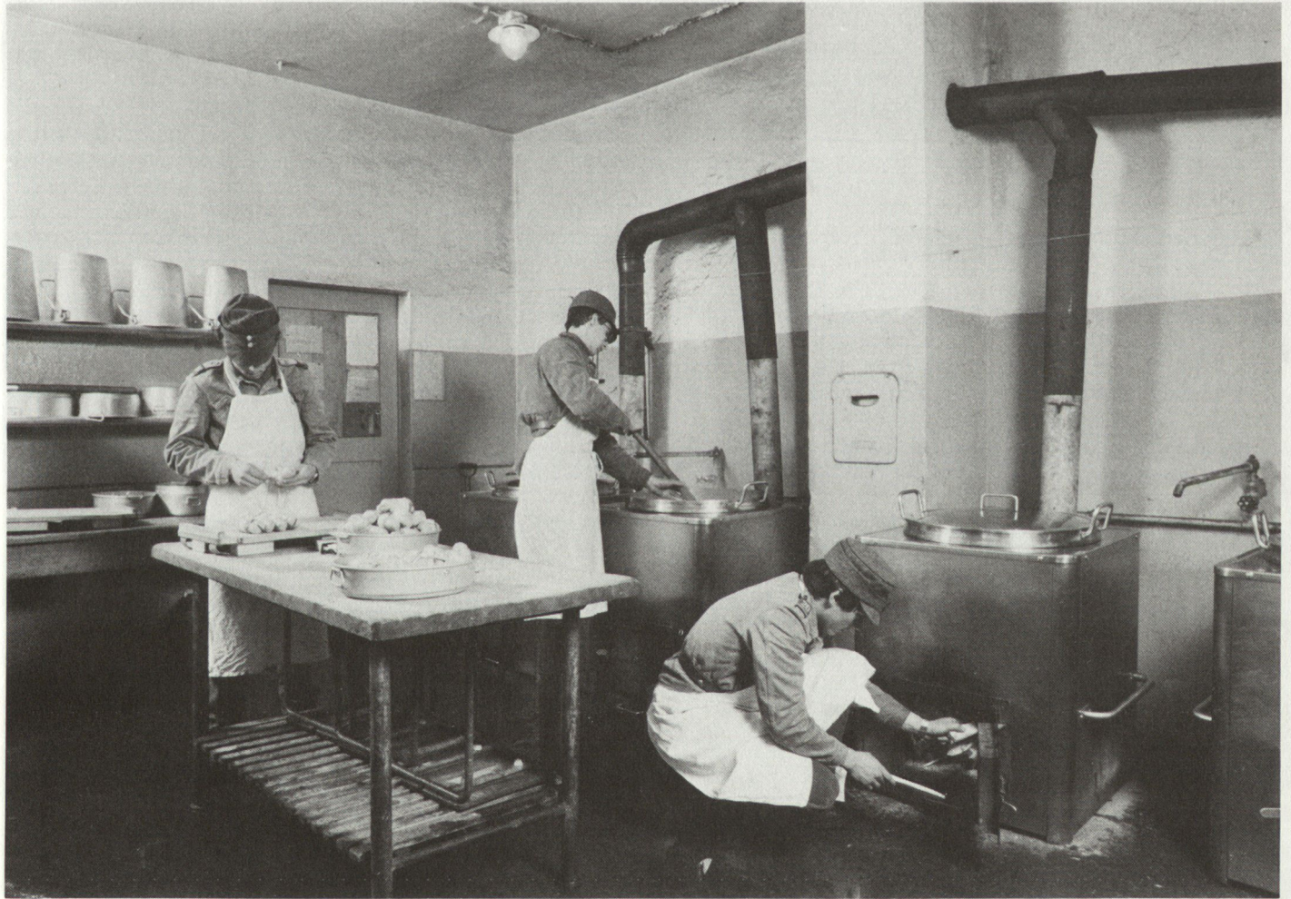
Bild 2. Truppenverpflegung aus der Gemeindegüche.

Das Verwaltungsreglement für die schweizerische Armee schreibt vor, dass die Naturalverpflegung der Truppe die Regel bilde. Zu diesem Zweck hat grundsätzlich jede Einheit einen gemeinsamen Haushalt zu führen, aus welchem die Truppe zu ernähren ist.