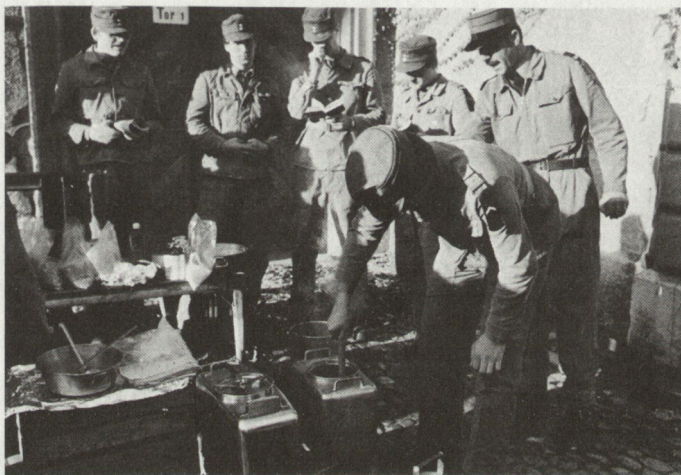
Bild 11. Ausbildung der Fouriere im Truppenhaushalt.

In der knappen Ausbildungszeit von 5 Wochen ist eine weite Palette (vom allgemeinen militärischem Wissen bis zur Gefechtsausbildung, vom Fachdienst bis zum Armeesport) von Ausbildungsstoff zu vermitteln. Selbst unter Berücksichtigung der Besonderheiten und Bedürfnisse einzelner