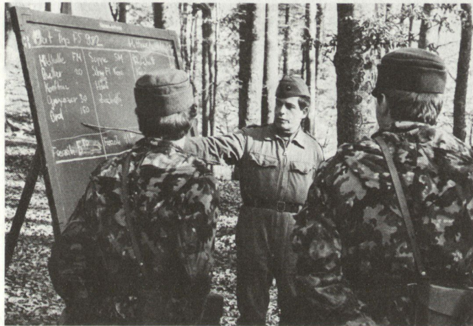
Bild 10. Unterricht Verpflegungsplan der Küchenchefs.

Die Ausbildung des Militärküchenchefs umfasst demnach ein grosses und weites Spektrum und beschränkt sich keineswegs auf rein fachtechnische Gebiete. Im Gegenteil, unter Berücksichtigung der Berufsstruktur (zB UOS 2/81: 78% Berufsköche, 14% Metzger, 8% übrige Berufe, «Hobbyköche») liegen die Hauptakzente der Ausbildung nebst der Organisation des Küchenbetriebes und der Ausbildung der Kochgehilfen insbesondere auch auf der Führung der Gruppe im Fachdienst und im Kampf.