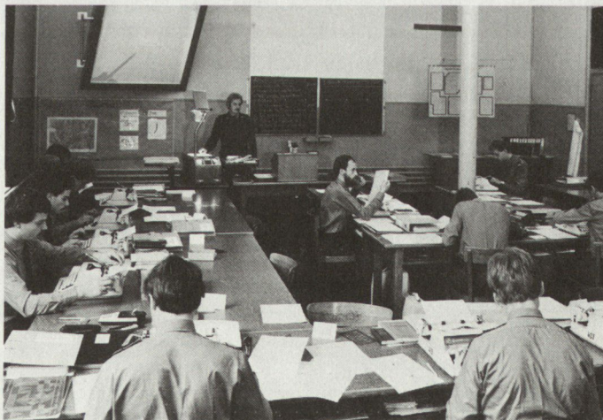
Bild 12. Theoretischer Unterricht der Fouriere.

Waffengattungen liegen die Schwerpunkte der Ausbildung in den beiden Bereichen «Truppenhaushalt» sowie «Buchhaltungs- und Verwaltungsdienst». Dabei liegt auf der Hand, dass wiederum die Berufsstruktur der Fourierschüler (rund 90% kaufmännische Berufe) eine eindeutige Priorität im Bereich «Truppenhaushalt» verlangt. Zumal auch im Gefechtseinsatz einer Einheit die Bedürfnisse der Truppe genau gleich gelagert sind! Vor allem wird auch deshalb im theoretischen wie im praktischen Unterricht das Verständnis für den Truppenhaushalt geweckt und gefördert. Im Vordergrund stehen eine geschickte Gestaltung des Verpflegungsplanes, der überlegte Wareneinkauf sowie eine zweckmässige und saubere Restenverwertung.