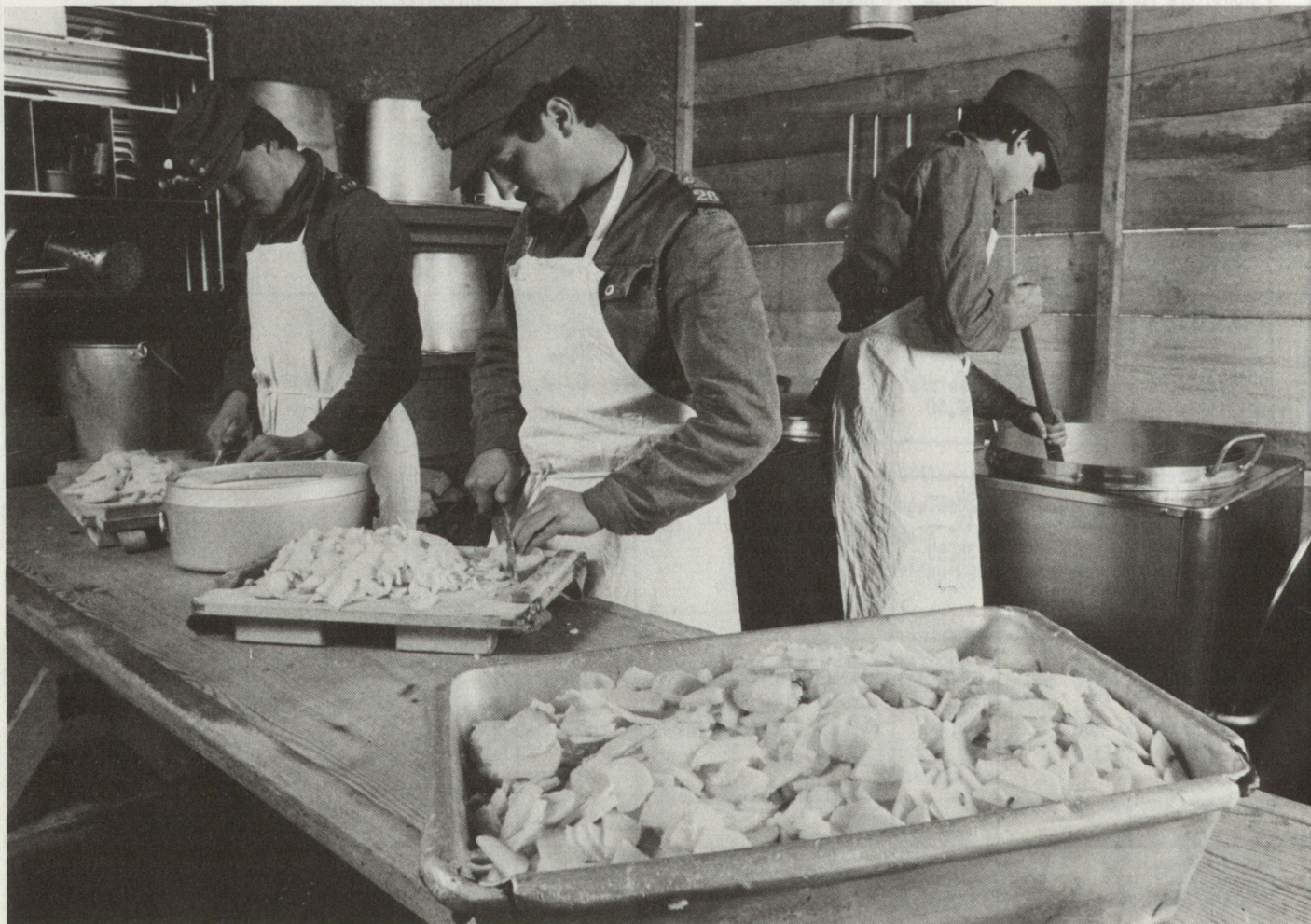
Bild 9. Praktischer Kochdienst der Küchenchefs.