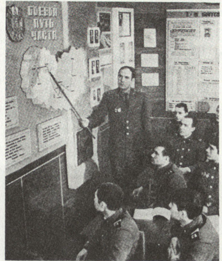
Bild 1. Neben militärischer immer wieder politische Ausbildung.

Sie wird als ein ununterbrochener Prozess zur Heranbildung hoher politischer, moralischer und psychologischer Eigenschaften der Angehörigen der Streitkräfte angesehen. Als «Be-