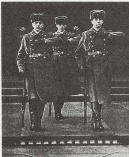
Bild 3. Eiserne Disziplin überall, auch bei der Wachablösung am Lenin-Mausoleum.

Die sowjetische Führung ist fest davon überzeugt, dass die Quelle ihres Sieges bei der Oktoberrevolution die