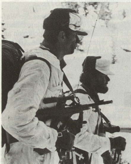
Bild 1. Das Sturmgewehr 77 hat sich aufgrund des geringen Munitionsgewichtes, der weitgehenden Wartungsfreiheit und der Optik, die dem Schützen besonders in der Dämmerung zugute kommt, sehr bewährt.

Diese Kampfführung bezweckt, unter weitgehender Erhaltung der eigenen Kampfkraft aber durch eine Vielzahl