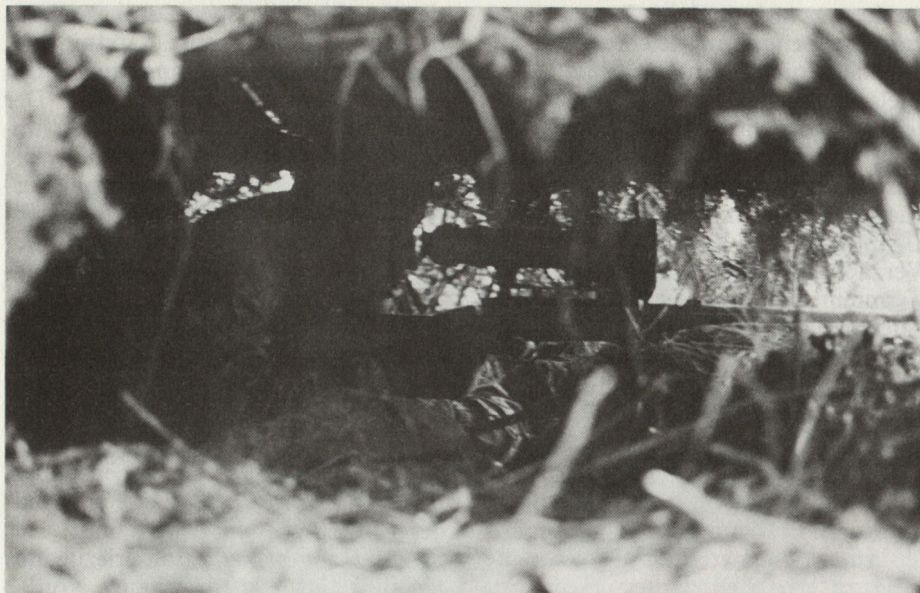
Bild 2. Scharfschütze mit Restlichtverstärker in eingedeckter Stellung.

zeuge werden die Bordwaffen gegen den nächstgelegenen Waldrand richten und aufmerksam beobachten. Die Aufklärung und Durchkämmung des Angeländes wird befohlen werden – man ist ja derzeit zum Warten gezwungen. Der Zugskommandant des einige hundert Meter entfernten Jagdkampfzuges entschliesst sich – vom hochgelegenen Standort seines stehenden Spähtrupps aus – derzeit nicht ins Gefecht zu treten. 12 Stunden später wird eine Kfz-Kolonnie mit Artilleriemunition und übermüdeten Fahrzeugkommandanten ein viel besseres Ziel bieten. Die mit Brandhandgranaten entzündeten Fahrzeuge werden die Strasse unterbrechen. Rasch herangeholte Infanterie gerät 5 km vor diesem Geländeteil in den Hinterhalt eines anderen Zuges. Dann wird die Bewegungslinie tiefgestaffelt vermint und Gefechtsfeldbeleuchtung vorbereitet, denn für diese Nacht ist eine breitflächige Unterbrechung der Bewegungslinien befohlen.