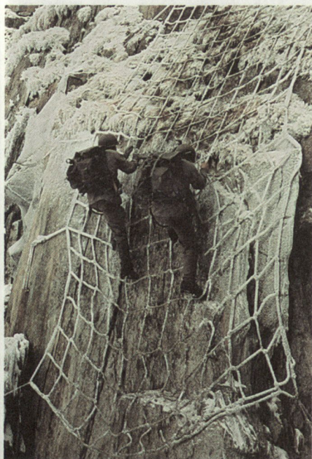
Begeharmachung am Fels

Die Ausbildung der Bergführer erfolgt durch die drei Patentkantone Wallis, Bern und Graubünden unter dem Patronat des Schweizer Alpenclub. Zur Zeit gibt es in unserem Lande zirka 1100 Bergführer, wovon etwa 600 während der Bergsteigersaison regelmässig über längere Zeit führen. In der Armee sind zur Zeit 384 dieser Gebirgsspezialisten als Bergführer eingeteilt (HE - Stabskp des Geb AK 3, Geb Gren Kp und Armeelawinendienst). Die übrigen sind entweder nicht mehr dienstpflchtig (Altersgrenze erreicht) oder wurden aus logischen Gründen in ihren Einheiten belassen. (Geb Füs / S Bat, Seilbahnbataillon u.a.)