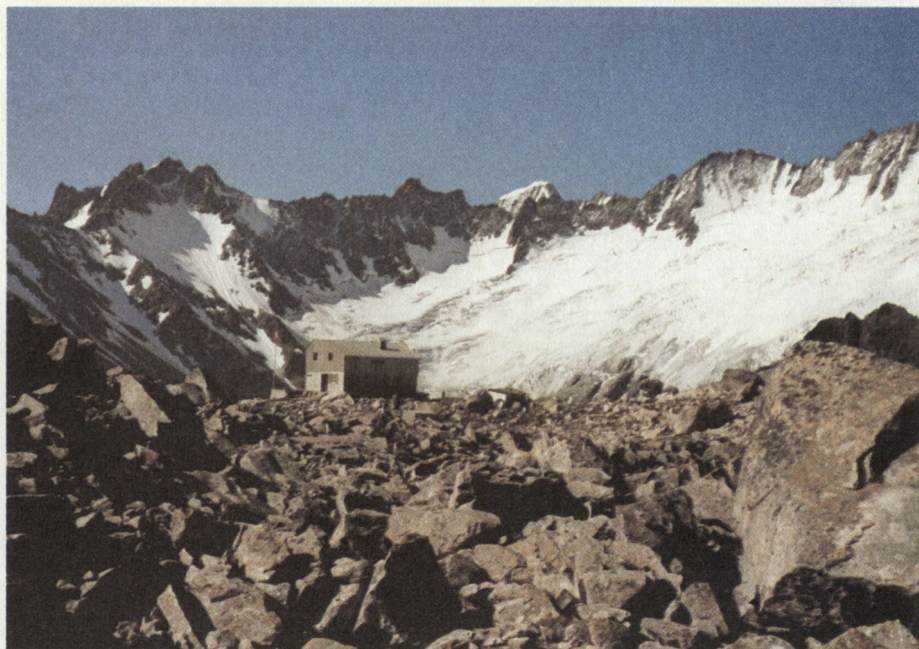
Ausbildungsraum Bergsee-Hütte (Göscheneral)

In der nächsten Zeit wird wohl eine neue Skibindung beschafft (im Versuch), Seilmaterial, Klettermaterial u.a. müssen ergänzt werden.