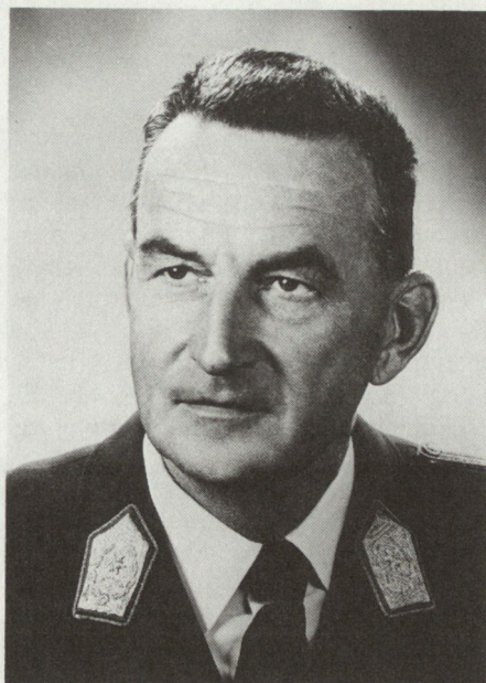
General Ernest Bernadiner, Armeekommandant, führt die Armee in Ausbildung und Einsatz.

ASMZ: Welche Erfahrungen haben Sie mit der Miliztruppe gemacht?