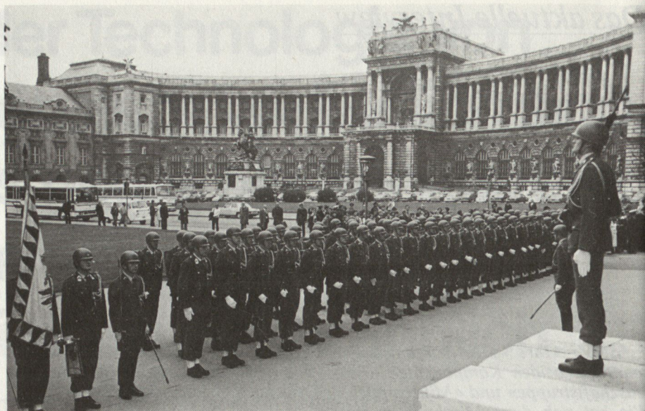
Ehrenkompanie im Areal der Wiener Hofburg.

A Kdt: Selbstverständlich wird in Form von Planspielen, Geländebesprechungen, Stabsübungen, Fernmelde-Rahmenübungen und Vollübungen die höhere Führung geschult. Es ist aber nicht so, dass jedes Jahr ein Kommando alles macht, sondern alternierend. Daher ergibt sich auch für die Vollübungen, für die Grossübungen, ein gewisser Zeitabstand, ein gewisser Rhythmus. Sonst würde ich nichts wie Übungen ausarbeiten und üben, üben und für Friedensbetrieb bliebe überhaupt nichts mehr übrig. Die Kommandanten möchten ja gerne pausenlos üben, aber leider geht das nicht.