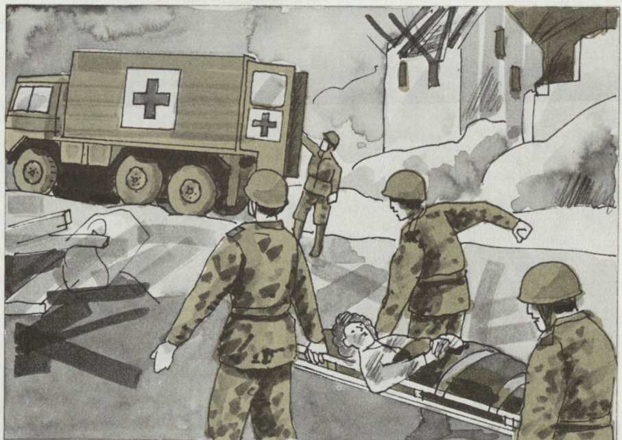
Versorgung und Abtransport von Verletzten.