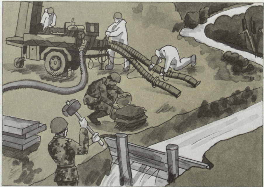
Erstellen von künstlichen Wasser- bezugsorten.