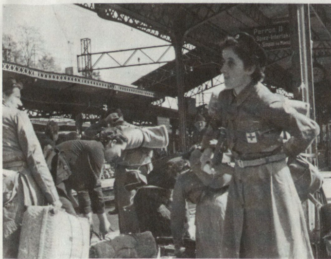
Bild 2. Einrücken von Krankenschwestern und FHD.