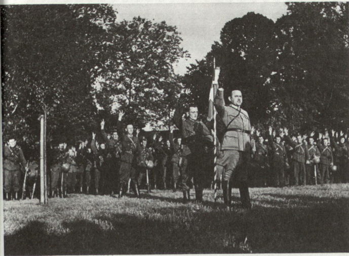
Bild 5. Fahneneid der Truppe auf ihrem Korpssammelplatz.