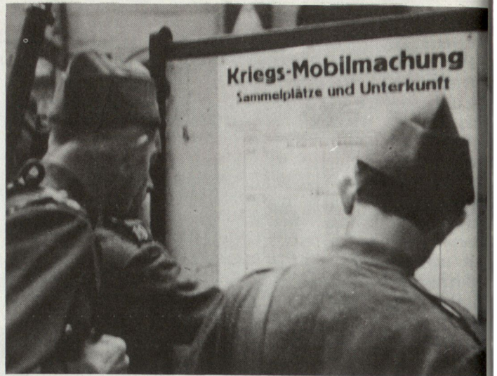
Bild 3. Einrückende Wehrmänner orientieren sich an einem Kriegs-Mobilmachungsplakat über ihre Sammelplätze.