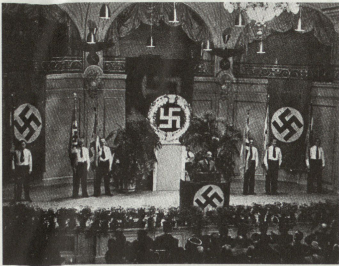
Bild 1. Die Ortsgruppe der NSDAP feiert den Geburtstag des «Führers» im Tonhalleaal Zürich. (Aus Werner Rings: Die Schweiz im Krieg, 6. Auflage, Verlag Ex Libris 1981)