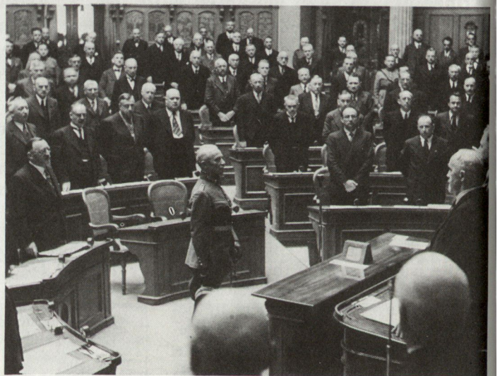
Bild 4. Am 30. August 1939 wird Henri Guisan vor der Vereinigten Bundesversammlung zum General vereidigt.

kommandostäbe, den Fliegerbeobachtungs- und Meldedienst sowie die Minendetachements. 35 Stunden bevor Grossbritannien und 41 Stunden bevor Frankreich den Deutschen den Krieg erklärten, war diese Teil-Kriegsmobilmachung abgeschlossen. Sie wurde mit Interesse verfolgt. Der Leiter der politischen Abteilung im Deutschen Auswärtigen Amt hielt fest: «Der schweizerische Gesandte teilte heute mit, dass der Bundesrat das Aufgebot des Grenzschutzes angeordnet habe. Die Schweiz glaube, nach dieser Massnahme ohne Allgemeine Mobilmachung auszukommen, die übrigens sehr schnell aufgelöst werden könne.»