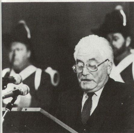
BR Georges-André Chevallaz an der Jubiläumsfeier der SOG, Herbst 1983.

Wenn Historiker und Staatsphilosophen in die Geschicke des Landes eingreifen, geschweige denn den Staat zu lenken berufen sind, geschieht dies zumeist unter dem Gebot der Stunde. Dies ist – wenigstens teilweise – Bundesrat Georges-André Chevallaz erspart geblieben, als er 1980 Vorsteher des EMD wurde.