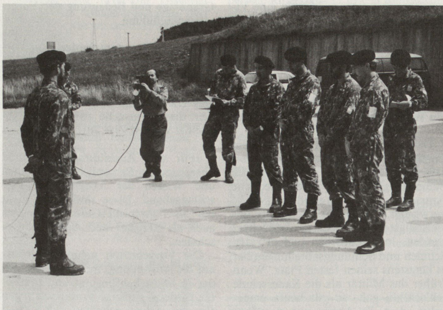
Praktischer Einsatz des Videoteams bei Übungsbesprechungen und Befehlsausgaben. Der Vorgesetzte kann sein Verhalten am Abend selbst beurteilen.

mente (Einleitung, Übungsphasen, Schluss) besprochen werden. Der Auszubildner sieht seine eigene Arbeit einmal aus der Sicht der Teilnehmer und lernt dabei Stärken und Schwächen beurteilen. Die Fremdbeurteilung durch die übrigen Teilnehmer ergänzt die Selbstbeurteilung. Ausserdem besteht im Sinne des Ideen- und Erfahrungsaustausches die Möglichkeit, alternative Formen zu erarbeiten.