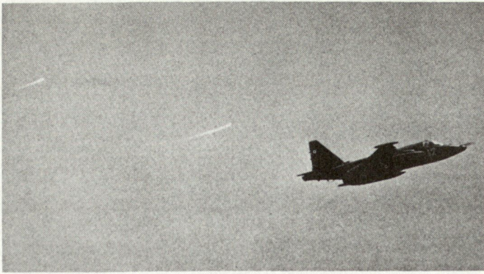
Bild 4. Die Sukhoi Su-25 «Frogfoot» im Einsatz gegen den afghanischen Widerstand. Links erkennt man zwei hellstrahlende Lichtquellen, die das Flugzeug soeben zur Irreführung von Infrarot-Zielsuchköpfen abgeschossen hat. Dank dem Fackelwurf (Flares) können Angriffsflüge gegen die mit SAM-7-Lenk Waffen ausgerüsteten Muejahedins jetzt tiefer und präziser ausgeführt werden. (Diese Aufnahme wurde von einem englischen Amateurphotographen gemacht, der vier Monate beim afghanischen Widerstand zubrachte.)