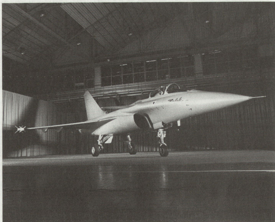
Bild 1. Der Vorserie-Prototyp «Rafale». Vorerst handelt es sich um ein einsitziges Mach-2-Jagdflugzeug von 9,5 Tonnen Leergewicht und zwei amerikanischen General-Electric-F 404-Triebwerken. Die Serienexemplare werden etwas kürzer, dafür um eine Tonne leichter ausfallen und durch französische Snecma M88-Triebwerke angetrieben. Man beachte die Rumpfform zum ungehinderten Anströmen der grossen Triebwerköffnungen.

Der Kampfwert dieses Mehrzweckflugzeuges hängt weitgehend von der Waffenzuladung und seiner Elektronik ab. Wie dem auch sei, für die «Rafale» bedeutet dies den Einbau eines zentralen Bordrechners mit Datenbussystem,