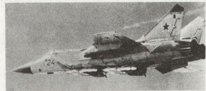
Das sowjetische Kampfflugzeug MiG-31, im NATO-Code als «Foxhound» bezeichnet, ist ein Hochleistungs-Abfangjäger von der Kapazität des US F-14.

ihrer militärischen und technischen Entfaltung erblicken, ist es für die Gegenpartei zu einem Fass ohne Boden geworden. Dass dem so sein könnte, ist in der Zwischenzeit auch der Reagan-Administration klar geworden. In der exakten Kostenanalyse von Flugzeugprogrammen verfügen die Vereinigten Staaten über grosse Erfahrungen. Um sich eine genaue Kostenübersicht zu verschaffen, hat Washington ein Team von Finanzexperten nach Israel geschickt, um die Rechnungsbücher von Israel Aircraft Industries einzusehen. Gemäss ihrem Bericht ist die «Lavi» unterfinanziert. Bei den Entwicklungskosten um 13 Prozent, bei den Herstellungskosten um 52 Prozent und bei der Beschaffung von Ersatzteilen um 56 Prozent. Angesichts eines solchen Befundes heisst es die Konsequenzen ziehen. Verteidigungsminister Rabin schlug dem Kabinett vor, das ganze Programm zu strecken, eventuell sogar zu annullieren. Eine Alternativlösung wäre der Kauf von weiteren F-16-Flugzeugen, die dann mit israelischer Elektronik ausgerüstet würden. Doch in der Zwischenzeit ist die «Lavi» so weit gediehen, dass die Kosten einer Projektaufgabe die Entwicklungskosten übersteigen würden. Der Erstflug ist bereits für diesen September vorgesehen. Es ist wohl keine allzu gewagte Vermutung, dass diesbezüglich das «Go» oder «No go» wieder einmal in Washington entschieden werden könnten. ■