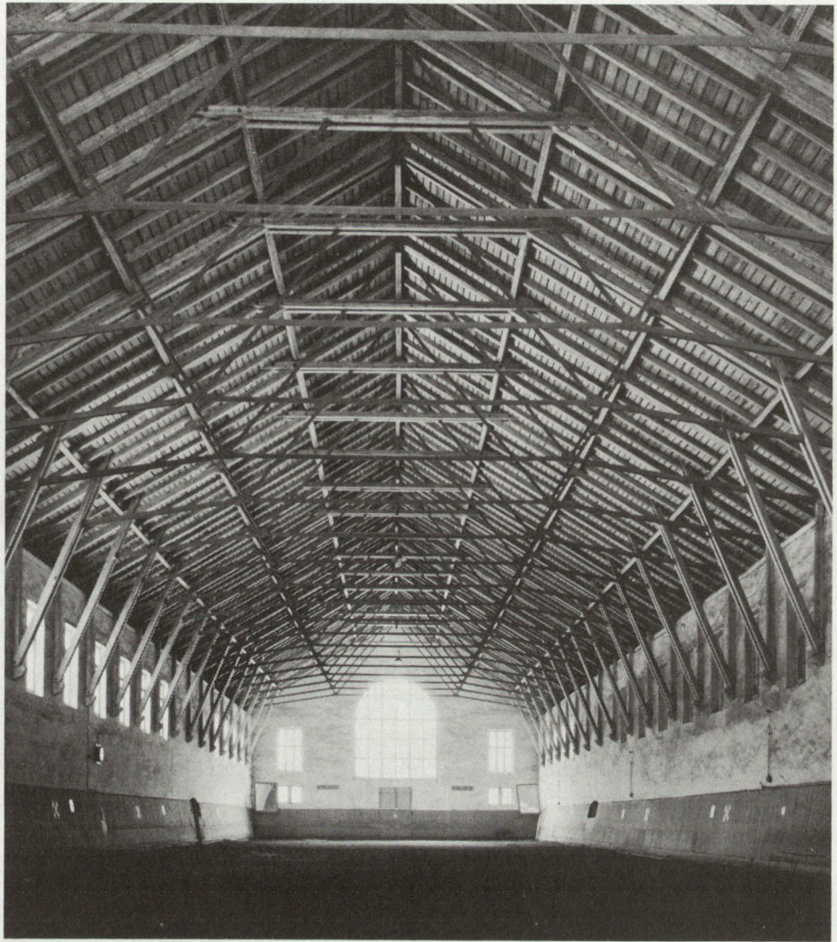
Blick in die alte Reithalle, in der das Armeemuseum entstehen soll.

Der Verein, der heute rund 3400 Mitglieder zählt, will einen Ort schaffen, an dem gezeigt wird, wie unsere Unabhängigkeit und Freiheit in Stunden der Bedrohung bewahrt wurde und wie sie in Zukunft erhalten werden soll. Das Museum soll durch Darstellung der Selbstbehauptung mit militärischen und friedlichen Mitteln zum informativen Zentrum des Wehrgedankens werden. Es dokumentiert die Vergangenheit und informiert über Gegenwart und Zukunft, macht die Integration der Armee in die Ge-