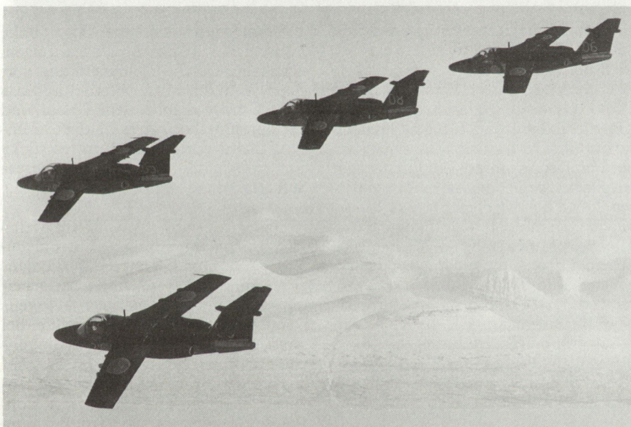
Bild 3: Die Saab SK 60 wird als Jettrainer und Nahunterstützungsflugzeug eingesetzt.