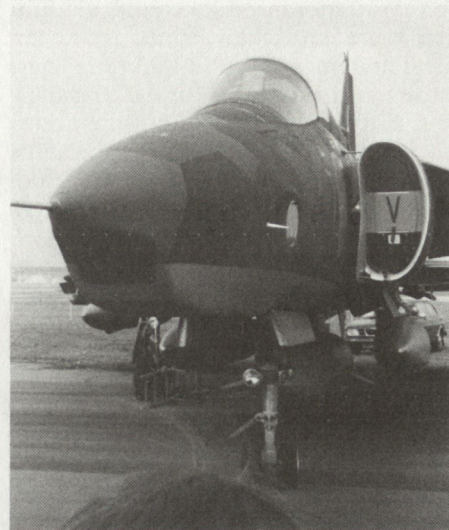
Bild 4: Rumpfnase des Saab SF 37 «Viggen»-Photoaufklärers. Kamerafenster für Frontalaufnahmen vorne, runde Öffnung für Seitenbildaufnahmen. Deutlich sichtbar zwei Behälter für Nachtaufnahmegerät, Beleuchtungsvorrichtung und an den Flügeln je ein ECM-Behälter.

doch die Fähigkeit, Kriegseinsätze von Abschnitten des schwedischen Strassennetzes aus zu führen. Um dies zu verwirklichen, braucht es anspruchslöse Flugzeuge, die über Kurzstart- und Landeeigenschaften verfügen.