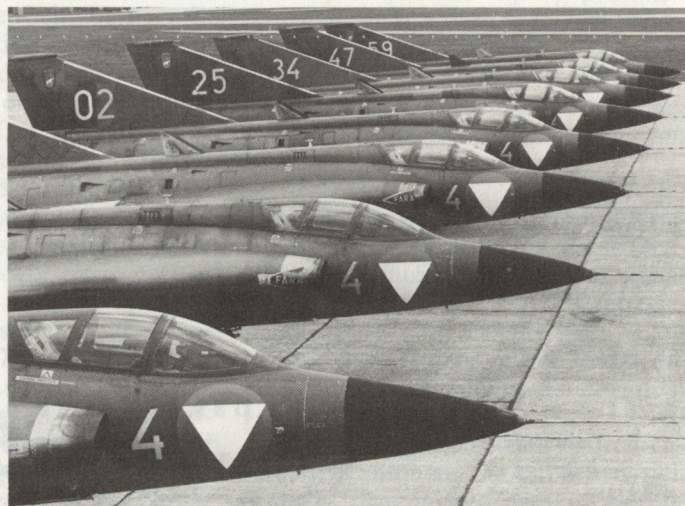
Bild 2: Saab «Draken» werden von FFV Aerotech für den Dienst in der österreichischen Luftwaffe vorbereitet.